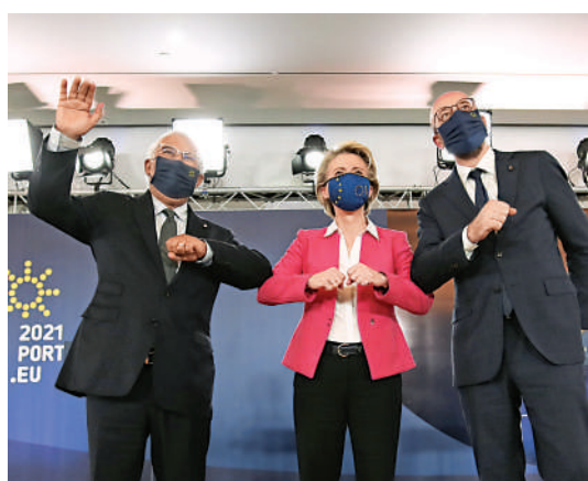
▲歐盟領導人8日與莫迪舉行視頻會議後，在葡萄牙召開記者會。

【大公報訊】綜合法新社、新華社報道：歐盟成員國領導人8日與印度總理莫迪舉行視頻會議，雙方同意恢復自2013年起擱置的自由貿易協定談判，加強經濟合作。有分析稱，近期歐盟對涉疆涉港等中國內政議題指手畫腳，導致中歐關係趨於緊張；歐盟恢復與印度的貿易談判，旨在藉此提升其在亞洲影響力。