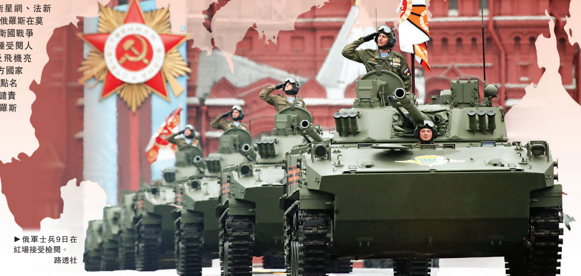
▶俄軍士兵9日在紅場接受檢閱。