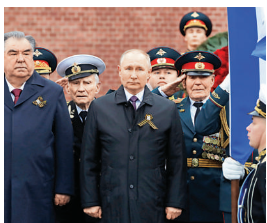
▲普京（中）9日出席閱兵式。

專家指，拜登與普京計劃於6月會晤，在此之前的反俄輿論戰、布林肯訪烏等，均表明美國仍試圖通過打烏克蘭牌來對俄方施壓。然而，美國及其盟友清楚俄方紅線所在，因此一直避免就加入北約一事對烏克蘭做出明確承諾。距離北約2008年表示願意接納烏克蘭已過去13年，雖然每次北約峰會都重提此事，但始終口惠而實不至。