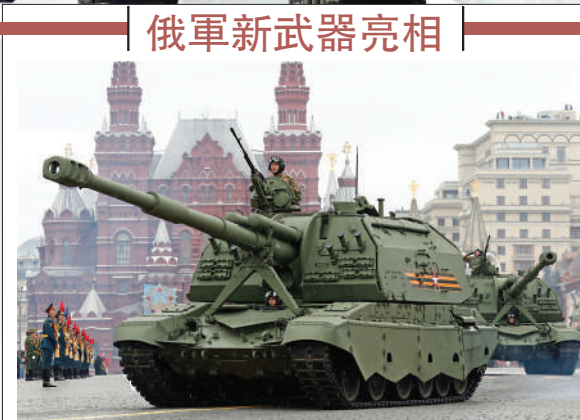
2S35聯盟-SV榴彈炮 俄羅斯最新研製的自行火炮系統，用於取代老式的2S19自行榴彈炮。該款榴彈炮採用全自動裝填的無人炮塔，最快射速可達每分鐘20發。