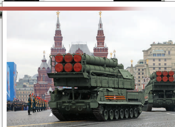
山毛櫸M3防空導彈系統 山毛櫸系列的最新改進型號，將原本裸露的導彈換成導彈發射筒，有利於導彈的儲存、保養和運輸；備彈數量也增加至6枚。