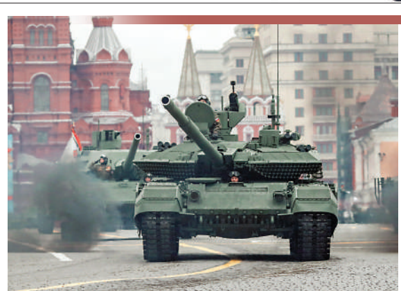
T-90M坦克 由T-90坦克改進而來，戰鬥力顯著提升，內部電子設備也大幅升級。去年4月，俄西部軍區列裝首批T-90M坦克。