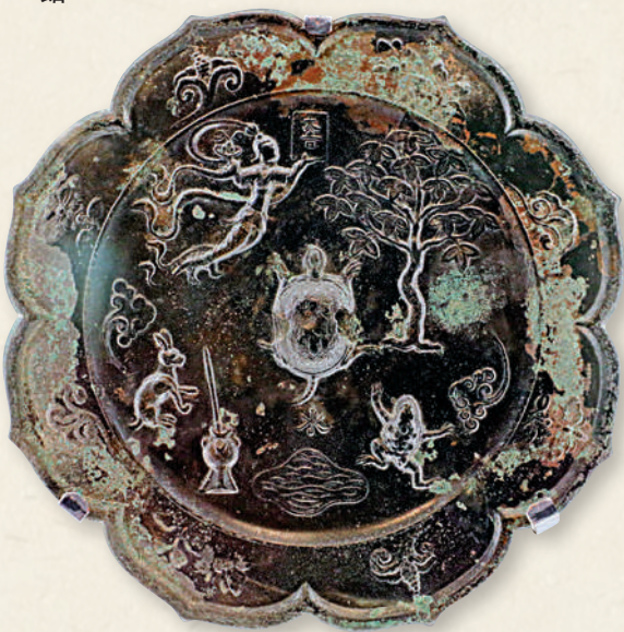
唐代「大吉」嫦娥月宮紋菱式銅鏡。中國國家博物館。