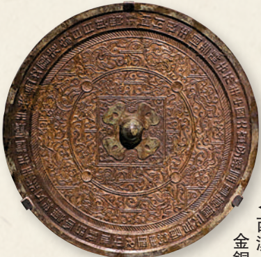
西漢「中國大寧」瑞獸博局紋鑲金銅鏡。中國國家博物館。