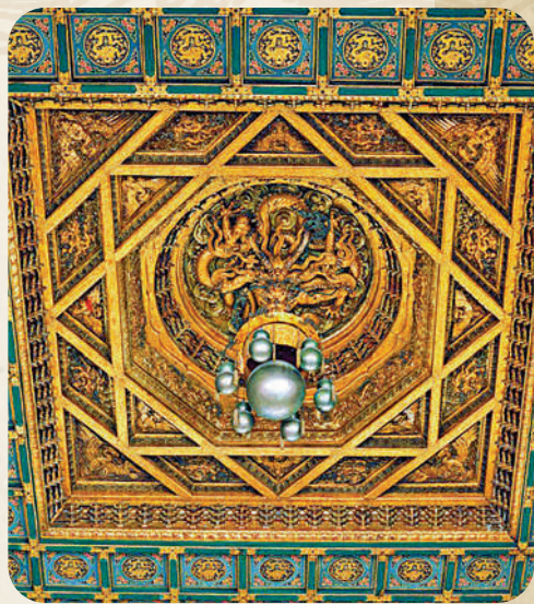
故宮太和殿蟠龍藻井軒轅鏡。故宮博物院。

宋元之前是銅鏡大放異彩的時期，元代起銅鏡似乎開始式微，特別是明清之際，玻璃尤其是透明玻璃興起，玻璃鏡迅速繁榮起來。玻璃鏡已經不限於照面，而是推廣至環境布置。最典型的例如故宮太和殿、乾清宮等主座宮殿蟠龍藻井裏的「軒轅鏡」、乾清宮正殿東西向的兩面大玻璃鏡。