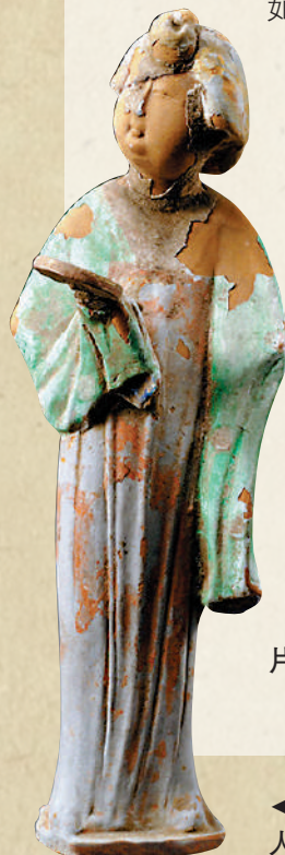
彩繪持鏡女立俑的出土，反映銅鏡在唐人生活中已不可或缺。陝西歷史博物館。