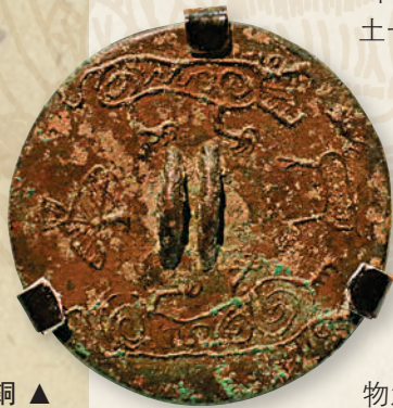
春秋號國墓地出土鳥獸紋銅鏡。中國國家博物館。