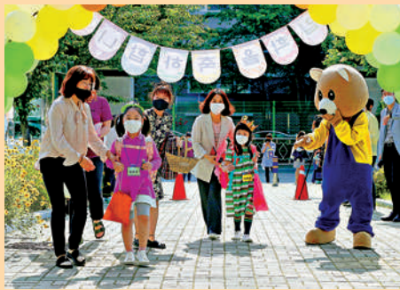
▲2020年5月27日，韓國蔚山大田小學的學生返回學校。

除了發放補貼和政策支持外，一些國家在住房方面也會向有子女的家庭傾斜。韓國政府到2025年將為多子女家庭提供2.75萬套專用公租房，並考慮將多子女家庭的標準從現行的3名以上子女放寬至2名以上；低收入家庭的第三胎起大學學費全免。新加坡在由政府建設的組屋出售時，給予有孩子的夫婦優先選購權，以鼓勵生育。如果是單身人士必須等到35歲及以上才能申請，且購房的補助也會比一對夫妻少很多。