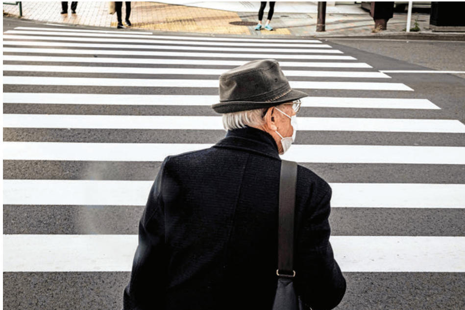
▲東京街頭一名戴着口罩的老者。