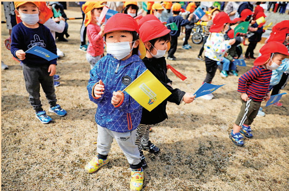
▲3月25日，日本福島縣兒童迎接東京奧運會火炬經過當地。

早在2006年，英國牛津大學人口學教授科爾曼作出預警，稱韓國將成為全世界第一個消失的國家。韓國出生率僅為0.84，全球墊底，相較於世界平均水平低65%。去年，韓國新生兒只有27.2萬，首次出現了死亡人口大於出生人口的「死亡交叉」現象。與此同時，低生育率也導致學生數量不斷減少，平均每年有30多所學校關閉。在未來20年內，韓國一半的大學面臨消失的危機。