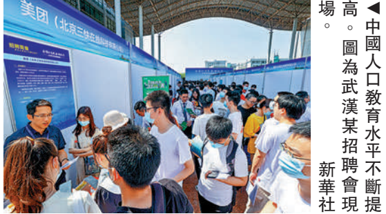
▲中國人口教育水平不斷提高。圖為武漢某招聘會現場。

此外，隨著經濟社會的快速發展，醫療服務體系的覆蓋面也在不斷擴大，人口的預期壽命不斷延長，人口健康水平提高，提供了重要的人力資源保障。