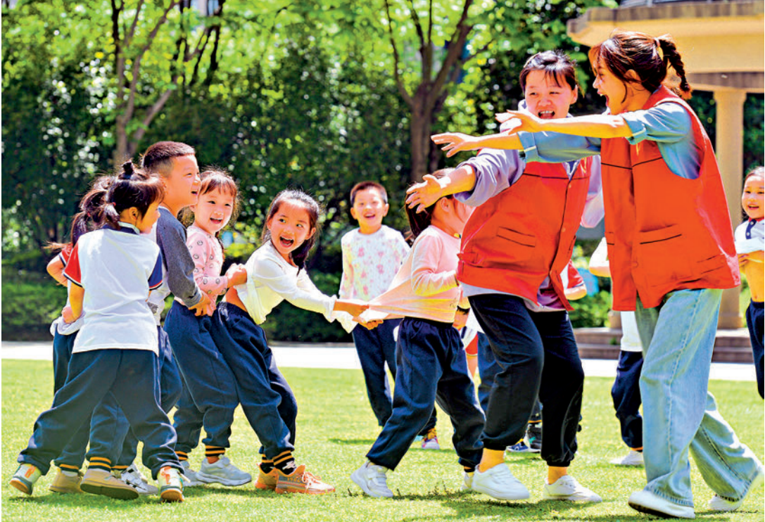
▲2020年中國全國人口繼續保持增長。圖為孩子們在戶外遊戲。