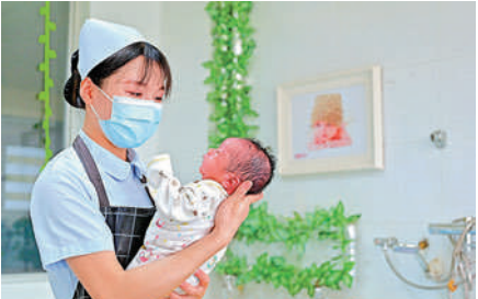
▲廣西南寧市一家醫院內，護士在護理新生兒。

近年來，由於生育政策調整等因素，全國多出生「二孩」數量達1000多萬人。寧吉喆指出，中國生育率降低主要受到育齡婦女數量持續減少和「二孩」效應逐步減弱的影響。新冠肺炎疫情增加了生活的不確定性和對住院分娩的擔憂，進一步降低了居民生育意願。寧吉喆說，低生育已經成為大多數發達國家普遍面臨的問題。根據國家統計局有關調查，中國育齡婦女的生育意願子女數為1.8，「只要做好相應的支持措施，實際存在的生育潛力就能發揮出來」。