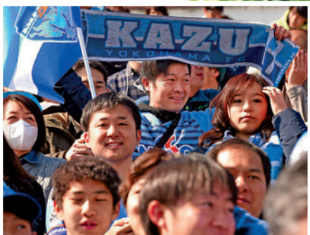
日本球迷一直非常擁戴三浦知良。