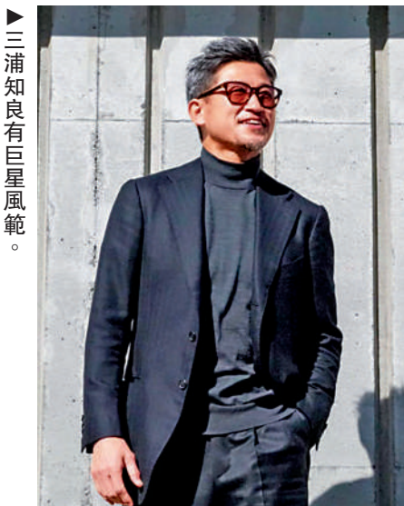
三浦知良有巨星風範。

年過半百仍然能夠踢職業聯賽，三浦知良必定有其養生之道，例如生活嚴守規律、注重飲食等，成功令自己的身體狀態「與真實年齡不符」。