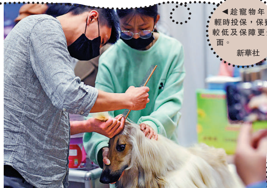
趁寵物年輕時投保，保費較低及保障更全面。