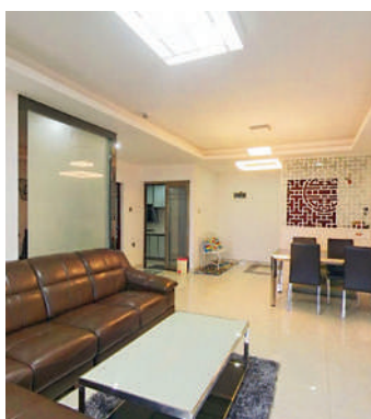
▲蘭亭國際內籠，物業毗鄰蓮塘口岸，通關和交通方便。