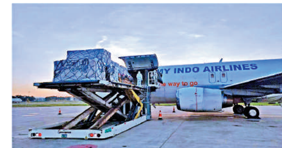
▲海口美蘭機場工作人員正在裝卸貨物。