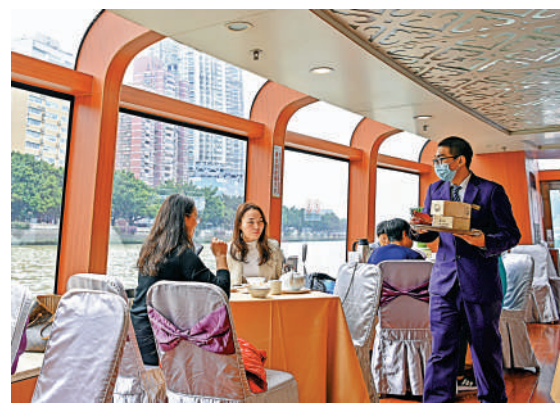
▲遊客在廣州品嘗早茶。

路、高鐵也將更高效地串聯起灣區城市群。據廣東省政府有關部門透露，目前正推進廣州、深圳兩大「都市圈」城際鐵路網建設，凸顯廣深在各自都市圈中的核心引領作用，未來兩到三年內建設25個重點項目。