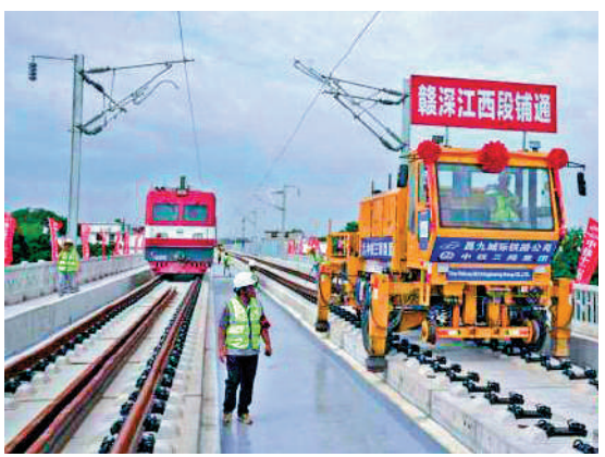
▲江西省贛州市上猶江特大橋施工現場。

【大公報訊】據中新社報道：16日上午9時58分，在江西省贛州市上猶江特大橋施工現場，隨着最後一組500米長軌平穩落在無砟軌道板上，贛深高鐵與昌贛高鐵線路南端成功對接，標誌着贛深高鐵江西段正線鋼軌鋪設全部完成。作為《國家中長期鐵路網規劃》南北大通道