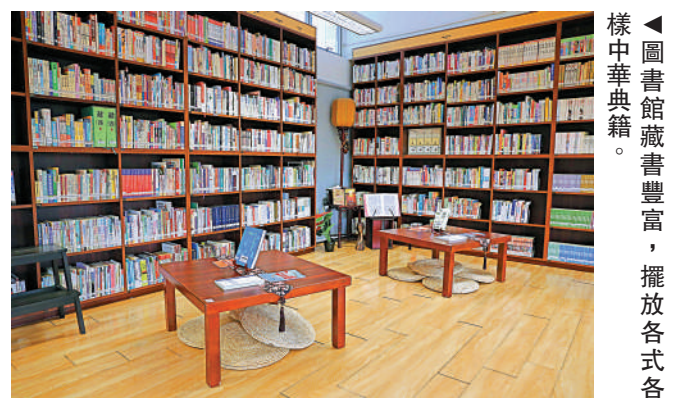
▲圖書館藏書豐富，擺放各式各樣中華典籍。