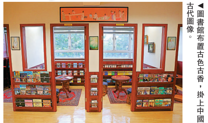
▲圖書館布置古色古香，掛上中國古代圖像。

走進圖書館會發現雖然西門英才中學的建設風格古典，擺放及掛上清明上河圖和書法，但設備卻與時並進，那裏擺放了一部觸控電視，學生可以戴上電視連接的耳機聆聽以國語誦讀和講解的多篇中華經典文章如：岳陽樓記、江雪和勸學等，讓同學們在堂上堂下都可以學習中國文學。此外，學校的室外操場牆上亦掛上了「中國世界遺產」的大橫額，橫額上介紹被列入《自然遺產名錄》和《文化遺產名錄》的中國世界遺產，例如：九寨溝風景名勝區和武當山古建筑群等。