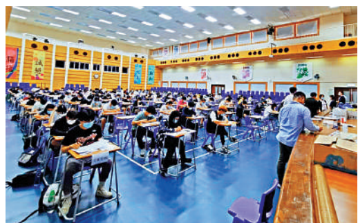
▲暨南大學和華僑大學兩校聯招考於上周末舉行，香港考場設於創知中學。本次考試共2275名港生參加。