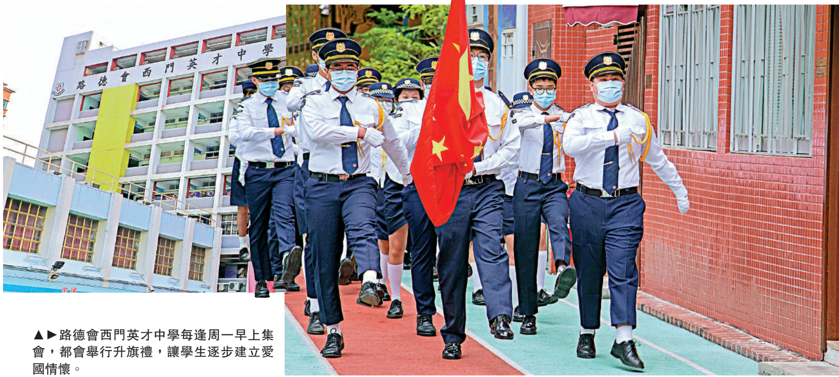
▲路德會西門英才中學每逢周一早上集會，都會舉行升旗禮，讓學生逐步建立愛國情懷。