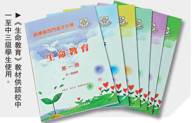
一▶《生命教育》教材供該校中一至中三級學生使用。