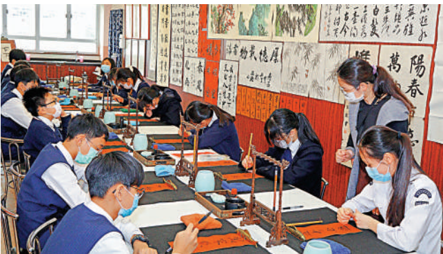
▲最具中國傳統文化氣息的書法室，是中一至中二學生要上堂的地方。

一樣。該校校長簡加言本身是一位中文科老師，她說年輕人較多是透過電視劇、電影和書本認識中國古代文化，她很想學生可以親實地