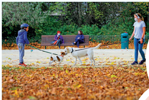
▲主人不妨多些帶狗出外活動。新華社