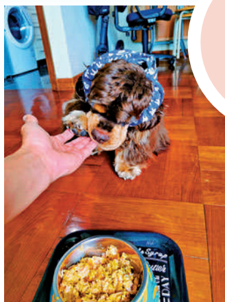
►狗狗對食物的期待，可減輕牠們對主人的思念。