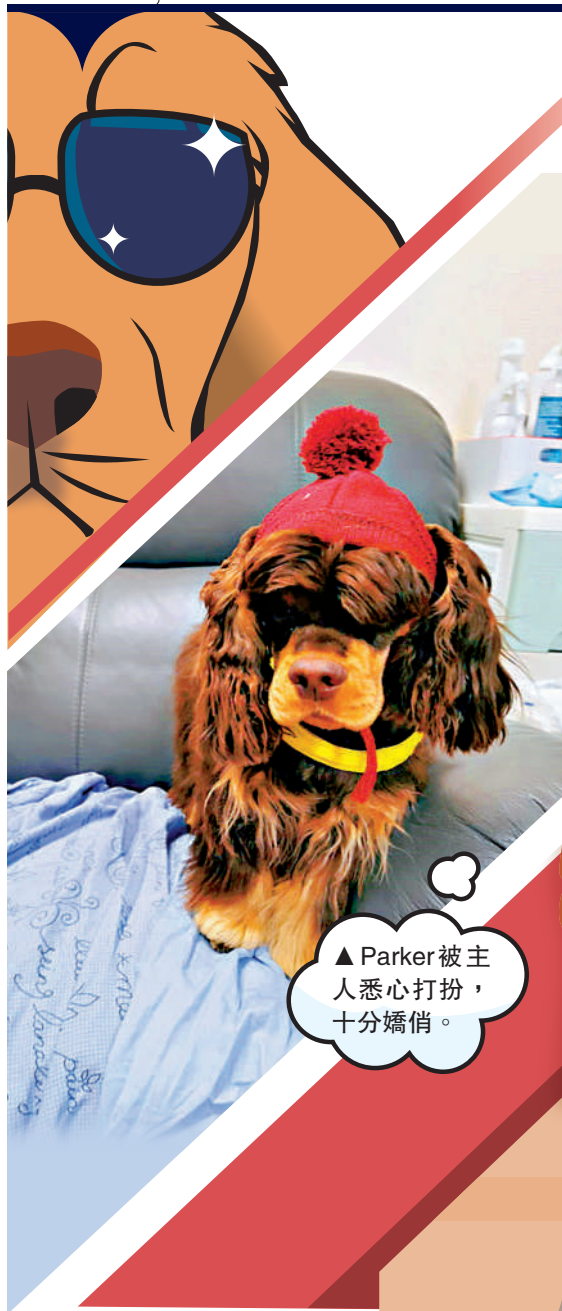
▲Parker被主人悉心打扮，十分嬌俏。