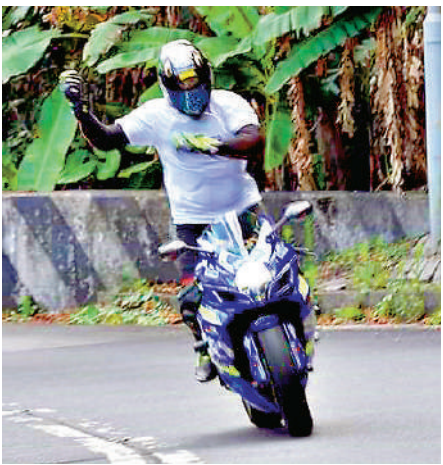
鐵騎士刻意放開雙手，站在車上模仿拉小提琴的動作。

經進一步調查後，警方發現該名司機持有電單車類別的暫准駕駛執照（P牌），涉嫌違反該執照的條件，接載一名19歲女乘客及沒有展示「P」牌，並向警方虛報獨自駕駛電單車失控引致交通意外。警方昨日（17日）在元朗區拘捕涉案司機，涉嫌「不小心駕駛」、「違反暫准駕駛執照條件」及「誤導警務人員」。被捕男子現正被扣留調查，案件交由元朗警區刑事調查隊跟進。