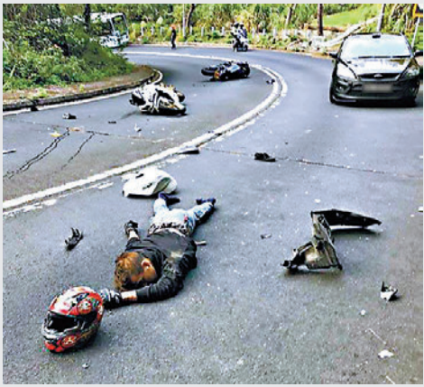
荃錦公路大帽山段「死亡」之彎曾發生多宗嚴重交通意外。