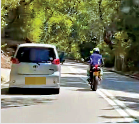
電單車雙白線高速爬頭，危害其他車輛安全。