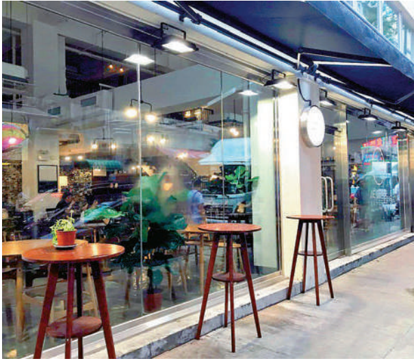
「桔梗」兩名負責人將接受警方電話預約拘捕。

針對此種現象，執業大律師陸偉雄對大公報記者表示，駕駛者有可能觸犯不小心駕駛道路交通條例，如龍友參與其中，也會觸犯協助教唆。陸表示，如果不是在公路上或一些公眾場所做出上述行為，一般不會遭到指控，但如果阻礙到其他道路使用者，根據香港法例第374章《道路交通條例》第38（2）條，任何人在道路上駕駛時，如無適當的謹慎及專注，或未有合理顧及其他使用該道路的人，即屬不小心駕駛。 龍友愛好者在擺拍期間，如果參與其中協商，有指定、要求或引誘駕駛者做出一些違規動作，則屬協助教唆。陸建議，為避免觸犯法規，一些活動最好在私人地帶進行。為己為人，市民都要遵紀守法，做個良好公民。