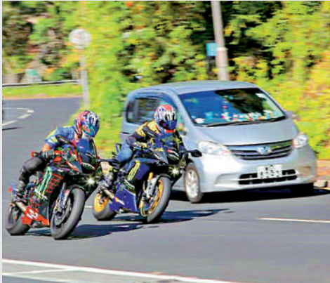
兩輛電單車並排在同一車道上飛馳，十分容易相撞。