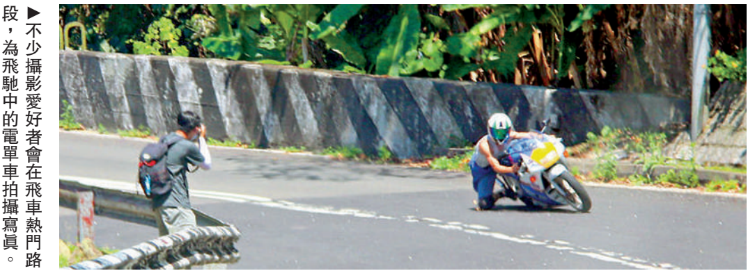
不少攝影愛好者會在飛車熱門路段，為飛馳中的電單車拍攝寫真。

片而發生意外，甚至惹上官非。 剛過的周日（16日）下午1時許，荃錦公路近八鄉石崗村發生交通意外，一名男子駕電單車往元朗方向至上址一處彎位時，電單車失控自炒。司機倒地輕傷，事後向警員報稱閃避狗隻失事。 惟事件到當晚峰迴路轉，有人在社交媒體貼出多張事發時電單車入彎炒車及事發後照片。有目擊者發文指，事發時電單車上載有女乘客，炒車後男司機着受傷女子先行離去再報警，質疑有人未有如實向警方交代意外詳情，涉嫌「妨礙司法公正」。據悉，在現場拍下事發經過的是一名專拍飛車寫真的拍友。 據文中多張照片顯示，事發前電單車後方坐有一名白衣女子，事發後，疑似男司機跪向一名受傷白衣女子。其後，一名自稱涉事司機的男子在社交平台發文否認指控，僅稱事件「我都有負責任」。