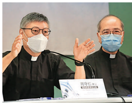
▲周守仁（左）希望日後可幫助更多弱勢群體，並與其他機構合作改善香港民生。

教皇方濟各於5月17日宣布委任周守仁為香港教區新主教，祝聖禮將於今年12月4日舉行。周守仁昨日在宗座署理湯漢樞機及輔理主教夏志誠陪同下會見傳媒，周表示，對能夠出任教區主教感到榮幸，香港教區成立已180年，形容自己擔任主教「頭頂好重」，任重道遠。他