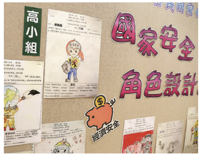
▲國安日當天，學校舉辦一連串活動讓學生們認識國安法。圖為國家安全衛士角色設計比賽展覽。

是次訪問被校長安排到活動室進行，室內放滿了不同主題的壁報板。還沒坐下來，朱校長就已經滔滔不絕地為記者介紹學校舉行的一連串愛國教育活動。