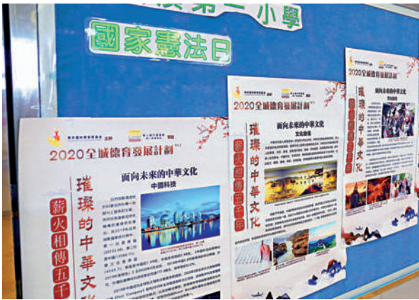
▲學校在國家憲法日，做了一個展示廊，讓學生認識中華文化。