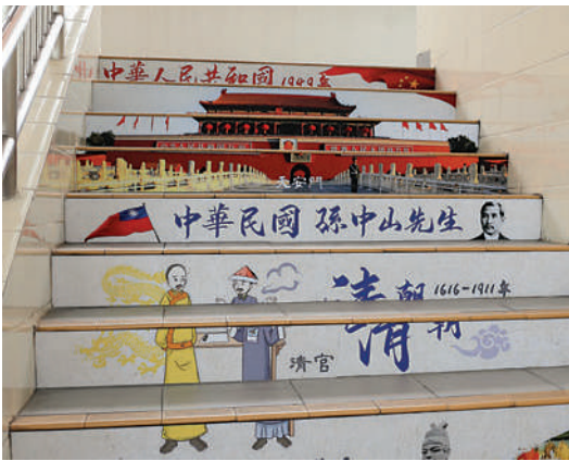
▲學校把將國民教育融入日常生活中，就連樓梯都能表達歷史時序。

在校園內，每一處都見到不少愛國教育的學習資源，如中華經典名句、學生參與4·15國家安全教育日的標語創作字句等等。在課室門口更貼有校訓，課室外牆則貼有教育推廣內容。另外，早前的4·15國家安全教育日，朱校長透露學校引用國家安全教育日概念，讓學生們張貼學生照片在宣傳板上，讓之成為一個大型的宣傳板放在校園內作宣傳，十分有意思，「保衛國家安全需要一些行動，我們當參與當中。」而學校更在校園的上落樓梯貼上中國各個朝代直至中華人民共和國誕生的時序，充分利用校園每一個位置作教育。