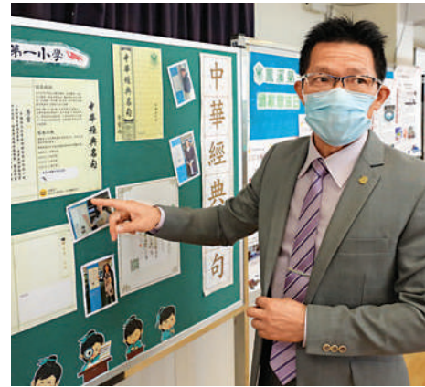
▲學校在教育局「中華經典名句」資料上，再加入校本元素，進一步在全校推廣。