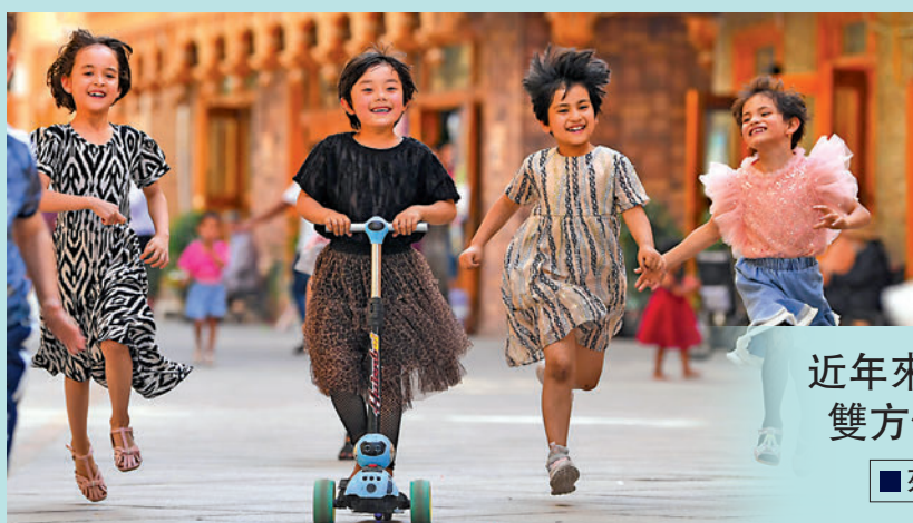
◀新疆兒童去年5月在和田市街頭玩耍。