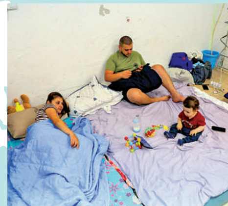
▲以色列南部阿什克倫一個家庭18日藏身防空洞。

當被問及中方對美方近日在以巴問題上的表態有何評論時，趙立堅表示，針對當前以巴緊張局勢，「兩國方案」是根本出路。希望美方言行一致，真正回到多邊主義，承擔起大國應盡的責任，支持安理會為推動緩解局勢、重建信任、政治解決發揮應有作用。