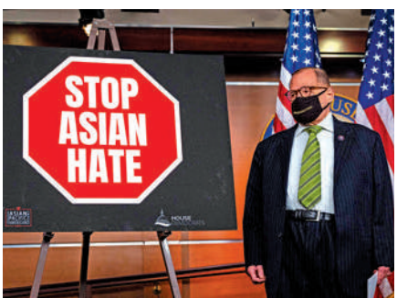
▲民主黨眾議員納德勒18日在國會山出席反歧視亞裔法案記者會。

裔的歧視和暴力犯罪事件激增。據美國反歧視組織「制止仇視亞裔美國人組織」統計，自去年3月以來，該機構共收到6603例亞裔遭襲擊案例。