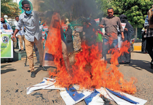
◀蘇丹民眾1月在其首都喀土穆焚燒以色列國旗，反對與以色列關係正常化。法新社

上周末開始，「巴勒斯坦與我無關」的話題標籤在阿聯酋、巴林和科威特的互聯網上流傳，被認為背後有當局的秘密操控。但這些國家的民眾對此並不買賬，繼續發聲譴責以色列的暴行。多伊爾認為，這些阿拉伯國家希望與以色列建立積極的外交關係，但又非常懼怕國內輿論，所以只能保持沉默。