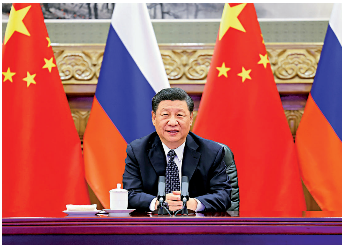
▲5月19日下午，中國國家主席習近平在北京通過視頻連線，同俄羅斯總統普京共同見證兩國核能合作項目——田灣核電站和徐大堡核電站開工儀式。

【大公報訊】中國國家主席習近平19日下午在北京通過視頻連線，同俄羅斯總統普京共同見證兩國核能合作項目——江蘇田灣核電站和遼寧徐大堡核電站開工儀式，兩國元首下達指令「開工」。習近平致辭表示，堅持安全第一，樹立全球核能合作典範。要高質量、高標準建設和運行好4台機組，打造核安全領域全球標桿。普京致辭表示，俄方有信心同中方共同努力，順利、安全推進工程建設。