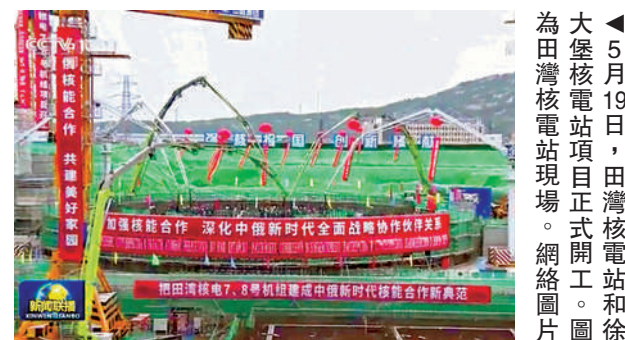
▲5月19日，田灣核電站和徐大堡核電站項目正式開工。

截至2021年5月19日，田灣核電站1-5號機組累計發電量已超2700億千瓦時，相當於減少燃燒標準煤超8200萬噸，等效減排二氧化碳超過21000萬噸。待田灣核電站7、8號機組建成投運後，年發電量約188億千瓦時，相當於減少燃燒標準煤570萬噸，減少二氧化碳1500萬噸。新機組建成後將有效減少二氧化碳排放量，既體現了中方力爭實現碳達峰、碳中和目標的決心，也彰顯了中方作為負責任大國的有力擔當。