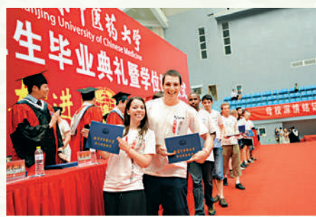
▲南京中醫藥大學面向全球，學生不單有港澳同胞，更有不少是外籍人士。

註：詳情請瀏覽國家人力資源和社會保障部網站(www.mohrss.gov.cn)，及國家藥品監督管理局網站(www.nmpa.gov.cn/WS04/CL2042/)。