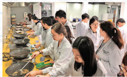
◀學生們在學習如何妙製中藥。

中大中醫學院於本港、內地，以至世界均有密切的交流網絡。在教學方面，中文大學的各臨床醫學系、中國語言及文學系等，為課程提供優質且專業的教學支援，學生有機會接觸不同領域的專家，啟發思維、開闊視野。在臨床方面，學院除了有自設的教學診所作臨床訓練外，更與本港及內地多間中醫門診和教學醫院有合作協議，為同學提供不同的訓練場所及畢業後的就業機會。