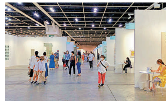
▲巴塞爾藝術展吸引不少觀眾前往。