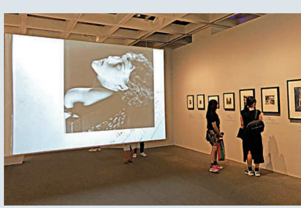
▲「巴黎之夜」展區。

該展覽是法國五月藝術節重點活動之一，由康樂及文化事務署、法國五月藝術節聯合主辦。