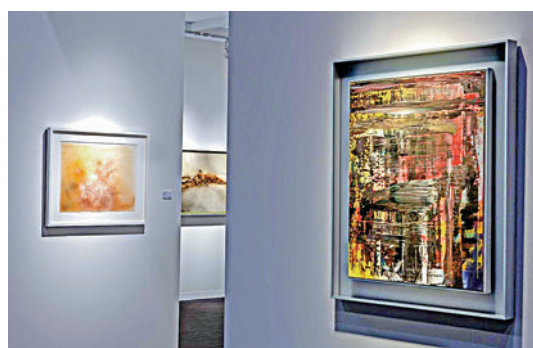
▲香港畫廊季豐軒以「30而立」為主題帶來四位藝術家作品。

定：「我的這件作品想表達對被破壞的傳統的恢復：用中式鈕扣來代表恢復，當然是有對中國文化傳統的期待和肯定。在今天的香港，我們能感受到對傳統的輕視，我用這件作品輕聲和堅定地說：不。」