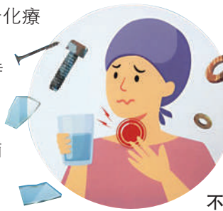
◀ 大多數癌症病人在接受治療後，會出現不同的口腔不適副作用。