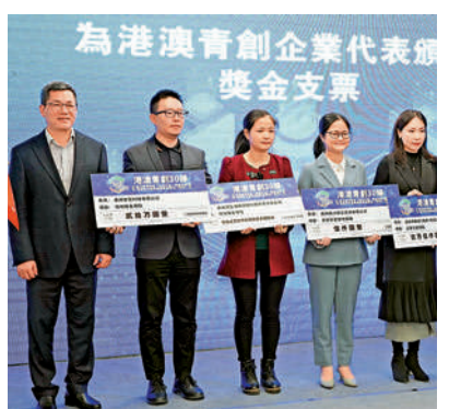
▲在去年「港澳青創30條」政策兌現發放儀式上，南沙區為港澳青創企業代表頒發獎金支票。

當天，受訪的南沙港澳公職人員表示，通過去年以來的工作，更增加對內地和大灣區的信心，未來，會以「新南沙人」、灣區人的角色，服務大灣區建設。