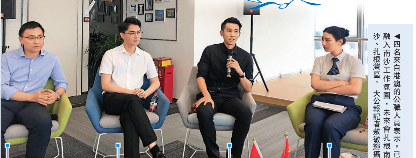
◀ 四名來自港澳的公職人員表示，已融入南沙工作氛圍，未來會扎根南沙、扎根本灣區。