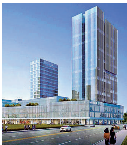
▲珠海市斗門區市民服務中心項目動工，將成為粵港澳大灣區青年創業中心。圖為項目效果圖。

數據顯示，與港澳地區一橋相通的珠海，目前成為港澳人士北上創業的首選之一，近兩年半年內已吸引超過4200家港澳企業入駐，科學研究和技術服務業、信息傳輸、軟件和信息技術服務業等行業佔近45%。