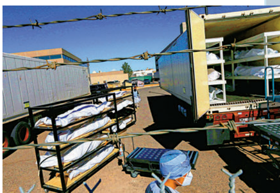
▲得州埃爾帕索縣去年冬季新冠疫情嚴峻，死者遺體要暫放在冷藏車中。

根據世衛發布的抗疫時間線，中國早在2019年12月31日就向世衛報告了武漢出現新冠病例。2020年1月3日，中方就已經開始正式定期向美方通報分享有關信息；2020年2月2日，美國政府就已經對中國封關。《紐時》披露稱，美國國家安全委員會在2020年1月初就收到情報，預測病毒將蔓延至美國，並提出了讓民眾居家辦公、封鎖大城市等措施。然而，時任美國總統特朗普擔心封城會影響經濟，對自己之後的選情不利，一直將疫情比作流感，淡化其嚴重性。由於特朗普政府抗疫不力，美國疫