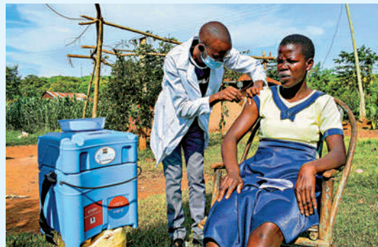
肯尼亞醫護人員18日為民眾接種疫苗。