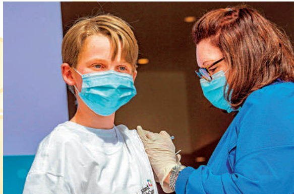
美國康涅狄格州一名13歲兒童13日接種疫苗。

譚德塞批評，疫苗分配中「可恥的不公平現象」正令這場疫情永久化。目前10個國家就接種了全球75%的疫苗劑量，一小部分國家製造並購買了大多數疫苗，控制了世界其他地區的命運。如果能公平分配疫苗，已接種劑量足以覆蓋全球所有醫護人員和長者，世界本可以處於