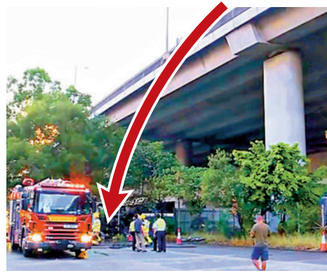
▲青葵公路發生炮彈飛車車禍，肇事私家車從橋上飛墮20米橋底（箭嘴示）。

▶墮橋私家車砸向一輛廢置車輛後起火，車內司機跳車逃生。消防員接報到場，開喉將火撲熄。