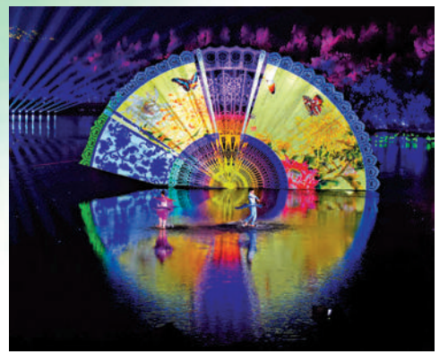
▲二〇一六年，二十國集團峰會在杭州舉辦，出席峰會的各國領袖晚間在西湖欣賞大型水上交響樂演出「最憶是杭州」。