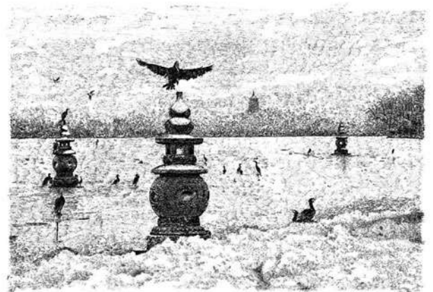
▲張建庭鋼筆畫《三潭印月》。