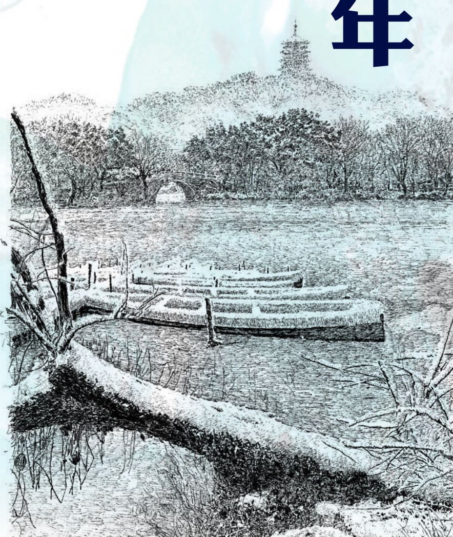
▲張建庭鋼筆畫《蘇堤 雷峰塔》。