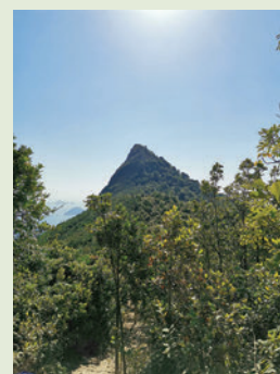
▲釣魚翁奇峰突出，是「香港三尖」之一。

清水灣泳場對面則是布袋澳，因海灣彎曲形如布袋而得名。布袋澳是個漁村，有小巴可以抵達，是有名的食海鮮之地，多家食肆瀕海臨風，食客可以一邊滿足舌尖上的享受，一邊欣賞風景。布袋澳吸引着饕餮之客如潮湧至，在節假日，灣裏更泊有不少遊艇。「十二逃犯」從布袋澳出發欲潛逃台灣，途中被捕，布袋澳因此更加聲名遠播。