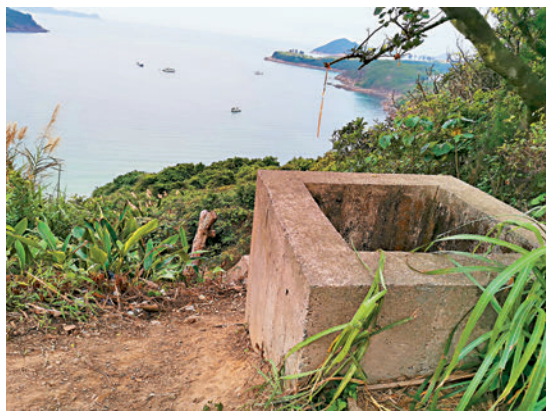
▲前往扭紋洞的下山路口石井位。