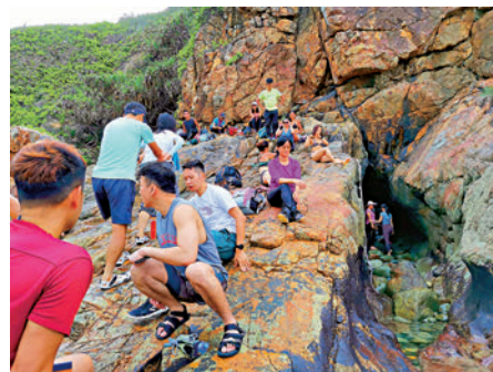
▲扭紋洞名氣大增，慕名而至者需排隊入洞。