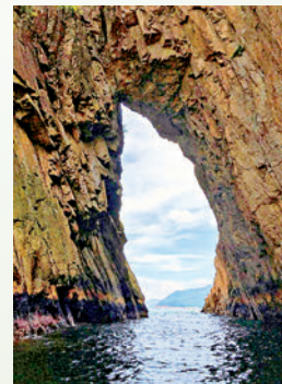
▲吊鐘洞是東海（西貢海）四大奇洞之一。

另一個值得注意的是，無論「海岸搵邊」還是進入海蝕洞，都是路途坎坷不平且濕滑難行，如果是「渡海搵邊」，會有海浪衝擊，為安全計，最好穿上特別的用於防滑的運動鞋，防水背囊也不可少。