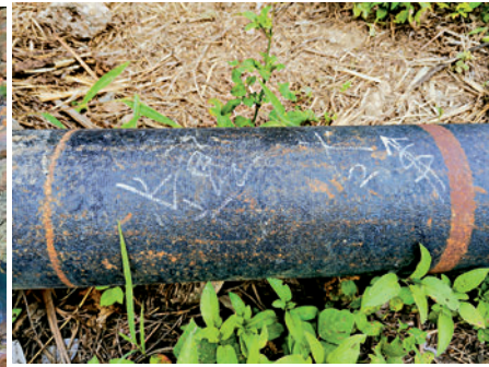
▲鏽蝕的水管上，前人留下的路徑指示。