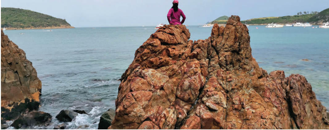
▲火星洞前的褚紅色岩石。