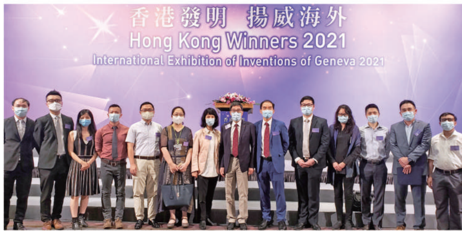
▲城大於日內瓦發明展囊括12個獎項，城大校長郭位教授（左八）、副校長（研究及科技）楊夢魁教授（左九）與城大得獎者早前出席由行政長官林鄭月娥主持的嘉許禮。

大學教育資助委員會（教資會）於5月24日公佈「2020年研究評審工作」，再次肯定香港城市大學（城大）的世界級學者、頂尖研究人員表現超卓。