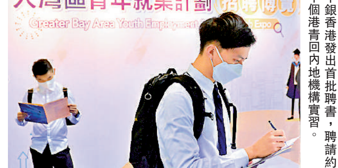
▲中銀香港發出首批聘書，聘請約數十個港青回內地機構實習。

學或大專院校畢業生到大灣區內地城市工作，名額2000個，當中約700個專為創科職位而設。