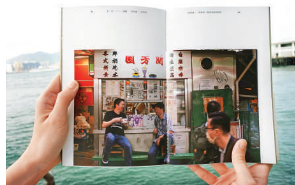
▲李亞妹著《一對絲襪，一杯奶茶》內頁。