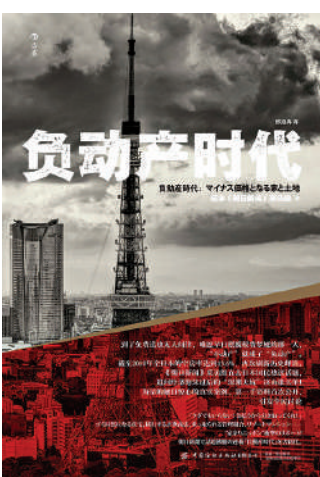
▲《朝日新聞》採訪組著，郎旭再譯《負動產時代》，中國紡織出版社。