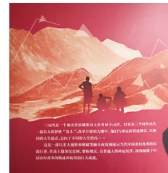
▲《三山凹》封底設計頗有意蘊。