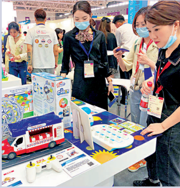
▲香港玩具創新、設計獨特，在今年3月深圳國際展覽會上，大受觀眾熱捧。