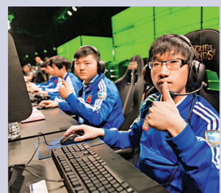
▲英雄聯盟S3世界總決賽上的Tabe（右一）和Uzi（右二）。