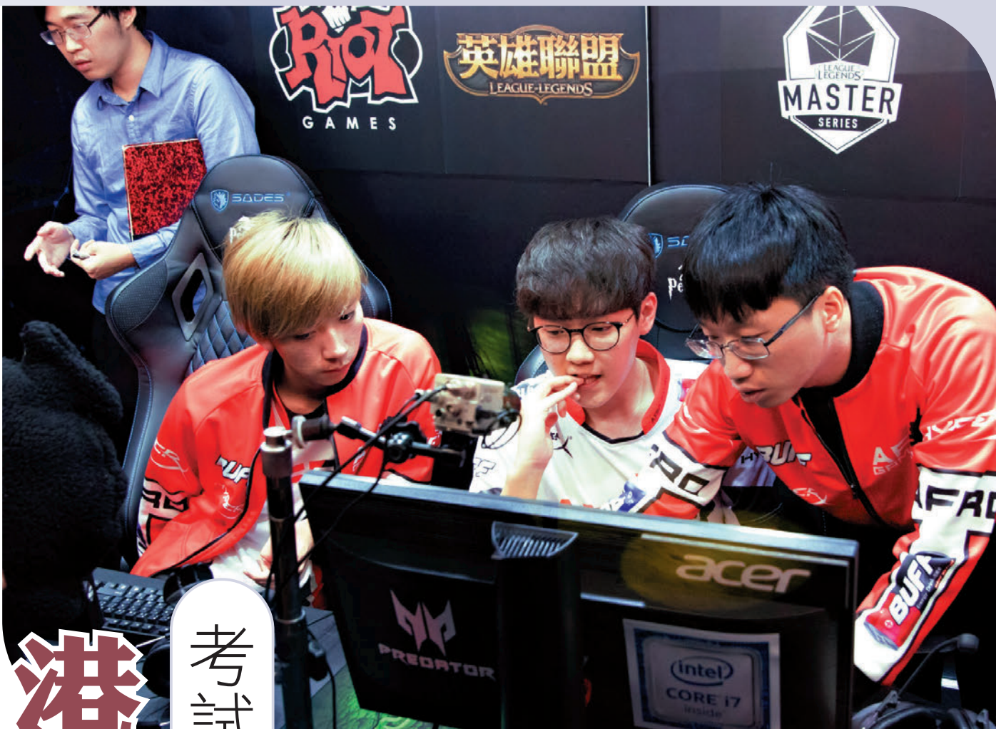
▲港青Tabe擔任知名俱樂部RNG的主教練（右），接連將2021《英雄聯盟》LPL春季賽和季中冠軍賽冠軍收入囊中。網絡圖片