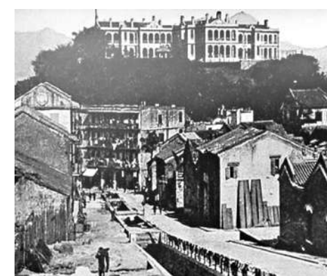
▲早年石水渠街為一條食水明渠，居民沿明渠展開生活圈，並於旁邊搭建木屋，在明渠取水清洗煮食。網上圖片

1840年代，灣仔春園街附近開始發展起來。寶順洋行東主顛地(Lancelot Dent)在此建一私邸「春園別墅」，其範圍由灣仔道伸展至大王東街。別墅內有一小湖供划舢舨之用，其水源乃由石水渠街所引入。而石水渠街中央位置的確有一條露天明渠，溪水從摩利臣山向北流至大海，即填海後的莊士敦道。