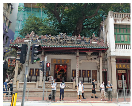
▲當年灣仔的海岸線在洪聖廟附近，即現時洪聖廟面向的大王東街和大王西街一帶。

1847年灣仔洪聖廟落成，至1881年港英政府正式把「下環」命名為「灣仔」。到了1982年香港建立區議會制度，原「灣仔區」與「銅鑼灣區」和「跑馬地」合併成大「灣仔區」，並沿用至今，所以現今的灣仔區並不只有灣仔，還包括了銅鑼灣、天后、跑馬地、大坑、渣甸山及灣仔峽等地。而灣仔現時已是一個薈萃多元文化社區，區內既保留了不勝歷史建築，也矗立許多設計獨特的現代建築，充分展現新舊交融的特色。