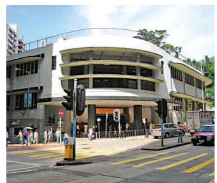
▲建於1937年的灣仔舊街市，為香港現存少數以包浩斯風格設計的建築物。

而藍屋建築群則饒富歷史韻味，以外牆顏色命名的黃屋、橙屋和藍屋，統稱為藍屋建築群。四層樓高的藍屋位於灣仔石水渠街72號，於1922年建成，擁有嶺南風格的陽台設計，及後獲古物諮詢委員會評為「一級歷史建築物」。這座建築物曾被用作學校，現時則為住宅，業權分別由政府及私人擁有。政府持有業權的部分，其外牆於修葺時用上水務署用剩的藍油，「藍屋」因此得名；至於灰色部分，則為私人擁有業權的部分，保留了建築物原來的顏色。發展局以「留屋留人」方式保育藍屋，邀請非牟利機構發展，有關機構須保留原有的一磚一瓦，而原本的居民則可繼續居住。