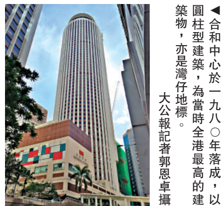
▲合和中心於一九八〇年落成，以圓柱型建築，為當時全港最高的建築物，亦是灣仔地標。