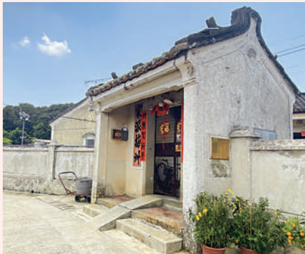
▲當年東江游擊隊曾在十八鄉組織營救活動，獲救的愛國人士和文化名人，由此渡過深圳河逃避日軍追捕。