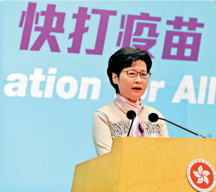
林鄭月娥強調，面對一些西方國家的霸權主義行徑，任何維護國家主權尊嚴和核心利益的中國人，都應該要有義憤填胸的立場。

香港在2019年6月爆發黑暴以來，美國參眾兩院就通過所謂「香港人權與民主法案」。而隨着香港國安法在去年6月生效，美國的所謂「香港自治法」在去年7月生效，目的是賦權美國政府以金融方式制裁實施香港國安法的政府官員。