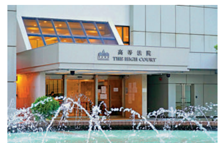
三名高等法院上訴法庭法官的任命，均於今日起生效。

林雲浩和周家明在2019年黑暴時，曾裁定特區政府引用《緊急法》訂立《禁蒙面法》違憲。終審法院前常任法官烈顯倫曾在報章撰文，批評兩人對「一國兩制」完全欠缺敏感度，甚至把自己抬高到全國人大的位置，通過自我賦權破壞一項重要的法案。烈顯倫亦批評，香港的法院持續把個人權利置於於公共利益之上，導致保護大多數人的法律被破壞，造成街頭混亂的社會環境。