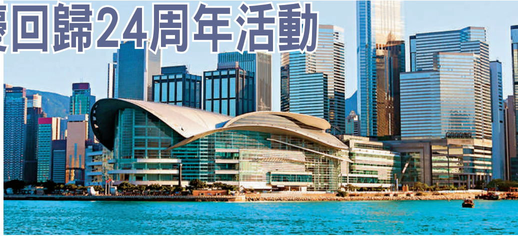
香港將舉辦各類活動，慶祝回歸祖國二十四周年。

的限制，規模可能不如往年大，但相信特區政府和不同團體的相關活動仍會繼續舉行。 林鄭月娥還表示，今年是中國共產黨成立100周年，她很高興獲邀參加一些相關活動，包括即將於6月12日在香港舉行的「中國共產黨與『一國兩制』主題論壇」等。