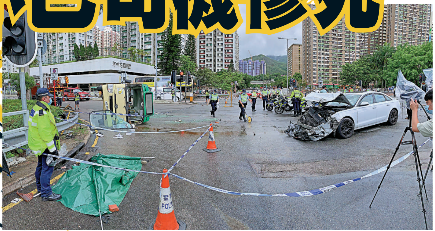
意外發生後小巴殘骸和玻璃碎片佈滿一地，私家車車頭嚴重損毀。小巴司機被救出時已死亡，警方用綠色帳篷遮蓋遺體。