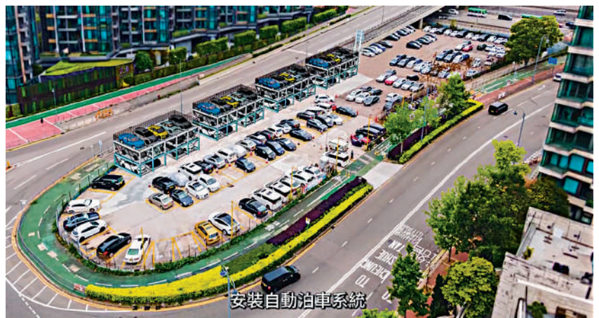
安裝自動泊車系統