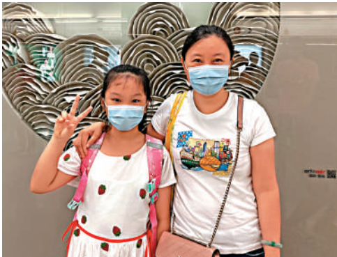
▲秦女士和女兒形容屯馬綫通車後，丈夫可以日日回家，一家三口終可團聚。