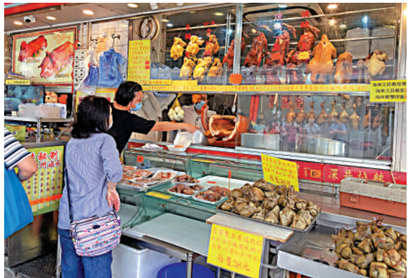
▲端午節氣氛低迷，燒味店店主表示，店舖今年的包糉量減少一半。

金雞海南雞的老闆蔡先生稱，近兩年生意少了三成，幸得店舖本身有明星效應，仍可支撐下去，今年端午節有幾十人預訂吃飯。由於店舖靠近宋皇臺站，他希望屯馬綫本月底全面通車後，能帶動部分生意，但也擔心經營成本會隨着增加，「業主都講到明，會加租兩成啦！」他估計兩三年內生意都難以恢復，唯有盼望疫情盡快過去。