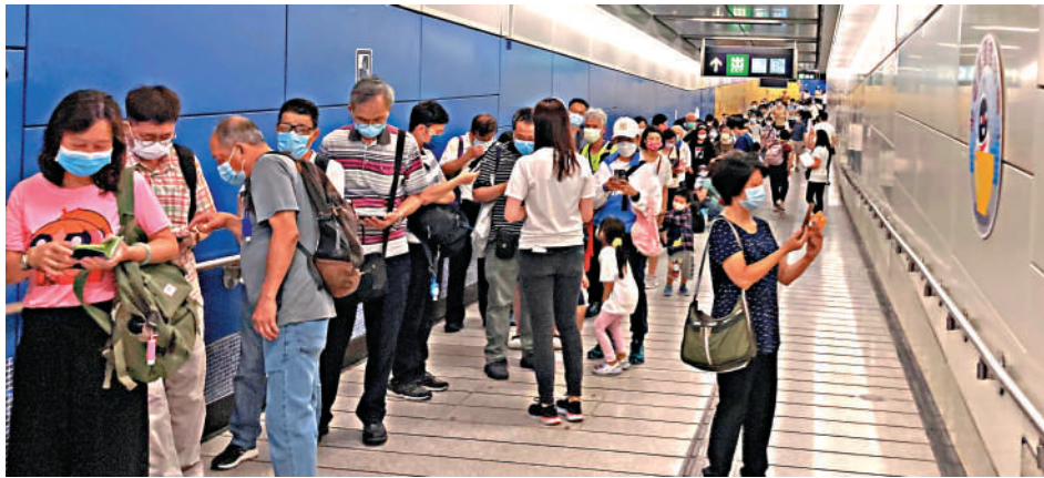
▲宋皇臺站開放參觀，全日吸引逾三千名市民到場遊覽。

家住天水圍的幾名學生，專程前來參觀。黃同學說，自己從小學就看着屯馬綫興建，對通車非常期待及興奮，第一時間就「搶飛」來