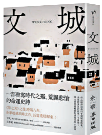
▲余華新作《文城》繁體中文版，台灣麥田出版。