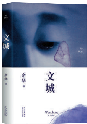
▲「文城」，既是余華新作的標題，亦是此書的靈魂。