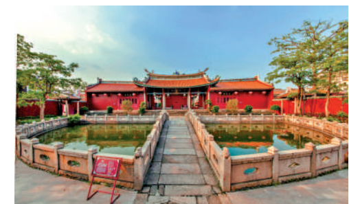
▲揭陽學宮有「粵東古建築明珠」美譽。現為全國重點文物保護單位。