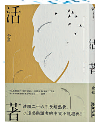
▲《活着》是余華的代表作之一。

尋找必有目的地，不論是物理空間，還是精神之域。《文城》有意味之處在於，林祥福在自己的目的地生活了半輩子，在這個地方獲得了財富和聲望，卻未能脫離「尋找」的命運。原因在於小美才是通向「文城」唯一的路，沒有小美的確認，「文城」無法開啟，也即不存在。林祥福的人生足跡，與其說是尋找，不如說是確認。余華在採訪中說，《文城》之所以寫那麼長時間，原因之一是他本想让林祥福一到溪鎮就找到了小美，然後可以有小美跟他回去或者不跟他回去兩種結局。但如果這樣處理，就和他最早寫小說的初衷不一樣了。對此，我十分認同。如果真的讓林祥福和小美見了面，林祥福在溪鎮的所有生活，以及作家所營構的一切，都會化作無意義的虛無。