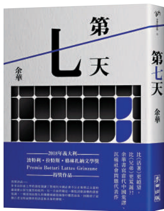
▲《第七天》講述一個普通人死後的七日見聞。