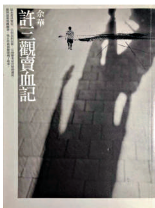
▲余華早期作品《許三觀賣血記》。