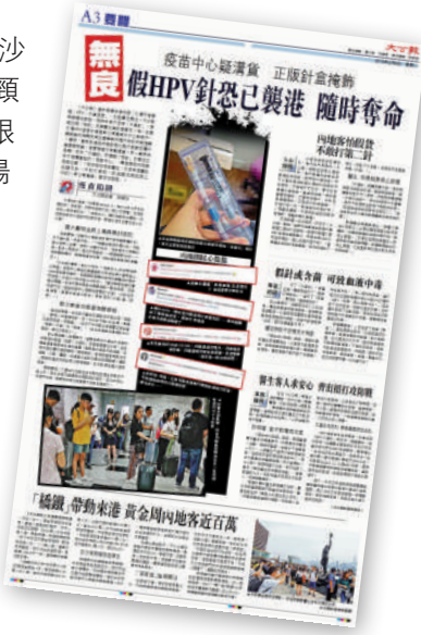
▲《大公報》前年獨家揭發本港出現水貨及冒牌HPV疫苗，報道引發社會廣泛關注。