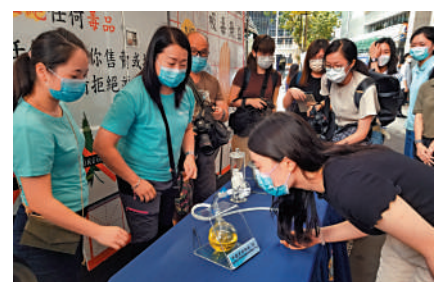
▲為提高青少年的禁毒意識，警方毒品調查科舉辦「禁毒月」，圖為仿製毒品氣味體驗。