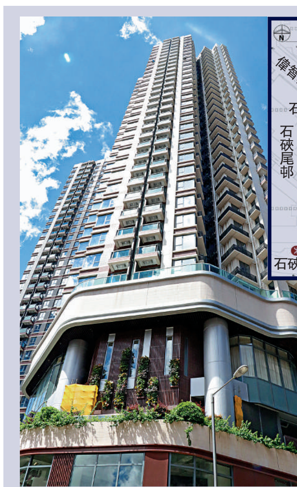
▲煥然懿居二期約260個首置單位，預料2023年預售。圖為煥然懿居一期。

至於靠背壟道項目，反對聲音較大，局方計劃在盛德街項目完成收購後，再逐一了解靠背壟道項目住戶的重建意向，若重建對住戶來說並不吸引，當局可能會放棄項目。市建局完成兩個試點項目後，會向政府提交建議。