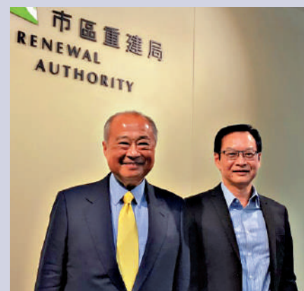
▲市建局主席周松崗（左）及行政總監韋志成見傳媒，透露市建局發展藍圖。