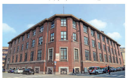
▲比利時南部城市沙勒羅瓦勞動大學圖書館。

1922年8月，聶榮臻在比利時加入了旅歐中國少年共產黨，從此開始走上為共產主義事業奮鬥的道路。