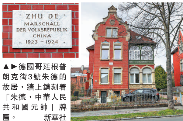
▲▶德國哥廷根普朗克街3號朱德的故居，牆上鑄刻着「朱德，中華人民共和國元帥」牌匾。新華社