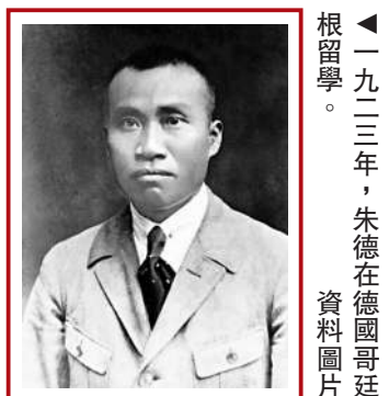
▲一九三三年，朱德在德國哥廷根留學。資料圖片 相見。在周恩來的幫助下，朱德當年11月在馬克思的家鄉德國加入了中國共產黨。德國柏林自由大學孔子學院名譽院長、漢學家余德美說，通過在德國的學習生活，朱德了解了當地政治組織的鬥爭策略、宣傳技巧以及一些德國軍隊的相關知識，這對他日後的革命生涯有不小的影響。中國哥廷根學聯主席王佳雲說，朱德的故事在學生活動中總會被提及，一直激勵着留學生的愛國、報國情懷。

德國中部城市哥廷根是一座風光秀麗的千年古城，以諾貝爾獎得主輩出的哥廷根大學聞名於世。如今在哥廷根大學中國學聯的網頁上，還可看到開國元勳朱德在哥廷根留學的簡介。哥廷根市檔案館保留着當年中國留學生的材料，在一張貼有朱德照片的泛黃的登記卡上，年輕的朱德身穿西裝，繫着領帶，濃眉下雙目炯炯有神，下方是朱德用德語親筆填寫的註冊信息，包括「姓名朱德」、「來自中國四川省」等相關內容。不同於一般的留學生，朱德留學時已年近40歲，從戎多年，他在這裏學習社會科學，拓展了視野，了解了西方工業國的情況。在德期間，由於參加聲援「五卅慘案」後上海罷工等革命活動，朱德曾兩次被捕。1922年，朱德在柏林與周恩來