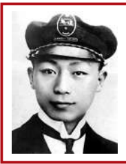
▲1922年，聶榮臻留學比利時。資料圖片