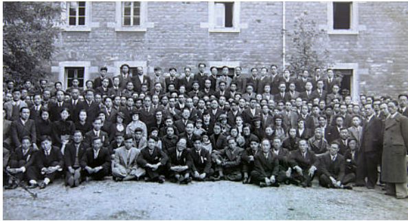
▲▼1920年代，旅法中國學生在里昂中法大學內合影的資料照片。下圖為法國里昂中法大學舊址。

負責人違背承諾，將留法的勤工儉學學生拒之門外，也成為「爭回里昂中法大學」運動的導火索。留法學生們在周恩來、蔡和森、趙世炎等人的領導下，開展了「爭回里昂中法大學」運動，但在法國當局的鎮壓下，運動最終失敗。法國里昂新中法大學協會副主席阿蘭·拉巴說，留法勤工儉學學生在里昂的政治活動和鬥爭雖然曲折，卻提高了青年學生的政治覺悟，一大批青年領袖從運動中脫穎而出，嶄露頭角。法國中國問題專家索尼婭·布雷斯萊說：「旅法勤工儉學這一次遙遠的旅程，讓中國進步青年在東方文化和西方文化的比較中，形成了救國圖強的新思想，而這段歷史也成為法中友誼的歷史紐帶。」