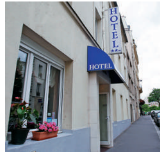
▶周恩來當年居住「海王星旅館」。

黨團活動，編輯革命刊物《少年》（後改名為《赤光》）。周恩來旅歐三年半，筆耕不輟，向《益世報》共撰寫了57篇通訊，近25萬字，稿件分析歐洲情勢，縱論國際秩序。1922年6月，在巴黎西郊的布洛涅森林空地上，周恩來、趙世炎等18名青年成立旅歐中國少年共產黨。不久，鄧小平也加入這一組織。1924年7月，周恩來結束旅歐生活。臨行前，旅歐中國社會主義青年團前身為他評定：誠懇溫和，活動能力富足，說話動聽，作文敏捷……英文較好，法文、德文亦可以看看報……熱心耐苦，成績卓著。