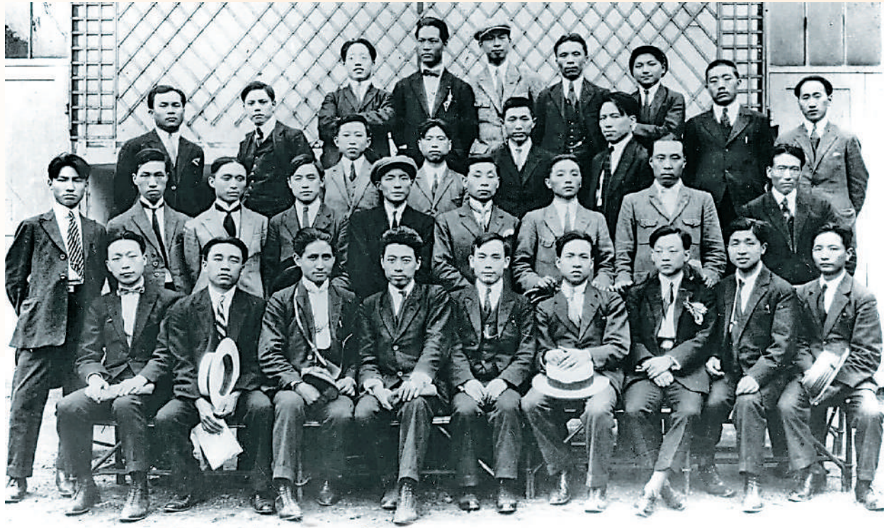
▶1924年，中國社會主義青年團旅歐支部部分成員在巴黎合影。前排左四為周恩來，左一為聶榮臻；最後排右三為鄧小平。新華社

【大公報訊】據新華社報道：時光倒流百年。一批批年輕人遠渡重洋，來到歐洲這個思想啟蒙和工業革命的發源地，一邊勤工儉學，一邊探究救國圖強之道。這些年輕人中的傑出代表，在學習中進步，在鬥爭中成長，他們意識到「實業救國」的願望非常不現實，他們堅信：只有馬克思主義，才能救中國；只有共產黨，才能實現中華民族的偉大復興。革命先輩熠熠生輝的青春歲月，令一代又一代青年心懷激盪。早期中國共產黨人在歐洲留下的紅色足跡，必將激勵新時代中國青年，在實現中華民族偉大復興中國夢的路上奮勇前行！