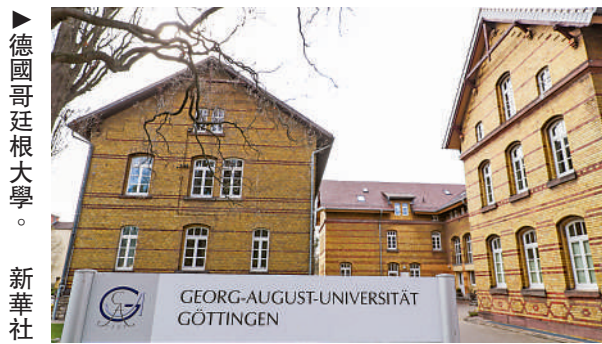
▶德國哥廷根大學。