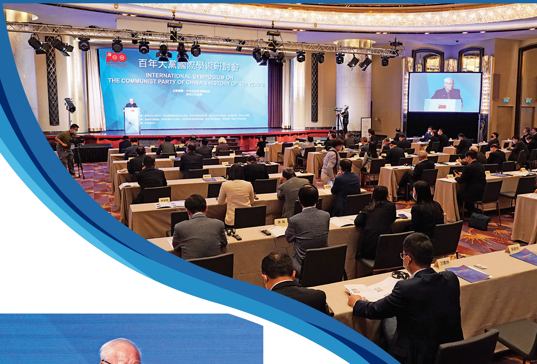
▲「百年大黨國際學術研討會」昨日在港舉行，近300名政商界知名人士、專家學者，以及多國駐港總領事出席。