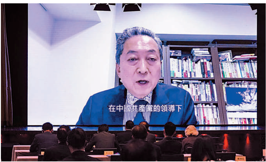
►日本前首相鳩山由紀夫指出，中國實現脫貧攻堅目標的成功秘訣，就是中國共產黨時刻和中國人民站在一起。

他首先回顧了新中國成立以來的法制建設歷程，指出1982年憲法，也是現行憲法，為改革開放新時期所有重大進展提供了憲法基礎。其中第五條明確了「中華人民共和國實行依法治國，建設社會主義法治國家」，對中國的法制進程具有關鍵意義。他並引述外國法學專家表示，中國共產黨領導下的中國法治建設，在速度和質量上，都獲得了國際認可與讚譽。陳弘毅還講解了「一國兩制」構想的由來和實踐過程，並引述鄧小平1984年的談話表示，指出「一國兩制」對於國際社會解決歷史遺留問題、國際爭端和平解決提供了參考，不僅有利於維持香港的穩定與繁榮，也有助於中國內地經濟發展與現代化事業。他最後引述中共中央總書記、國家主席、中央軍委主席習近平表示，中國要在2050年建成「富強、民主、文明、和諧、美滿的社會主義現代化強國」。他確信在「一國兩制」方針下的香港特別行政區，將為社會主義現代化建設和中華民族復興作出重要貢獻。