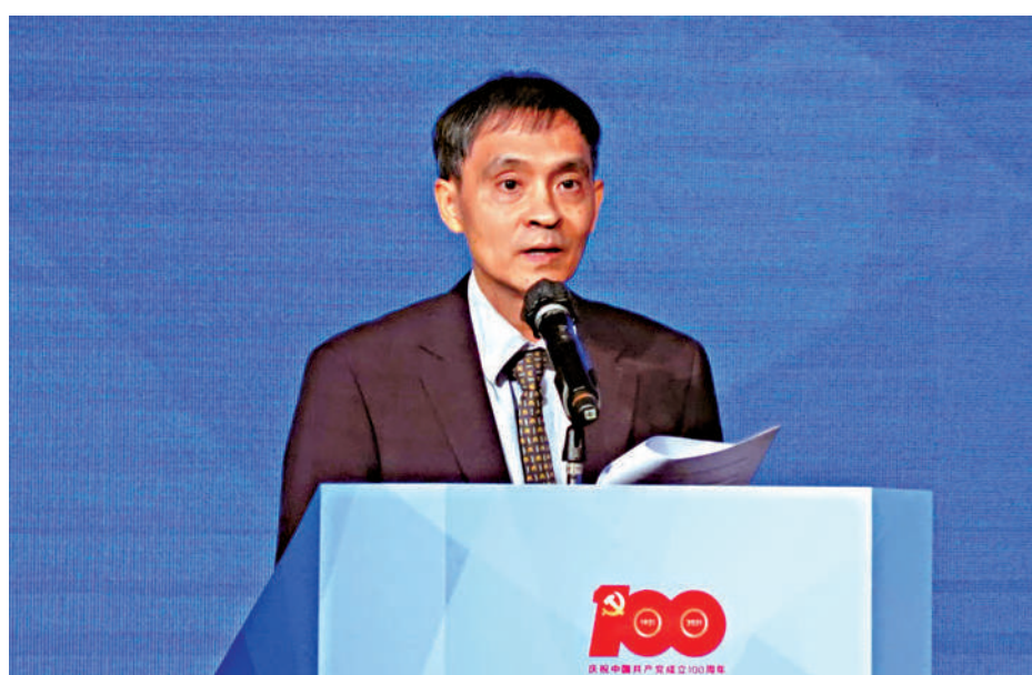
►基本法委員會委員、香港大學法學院教授陳弘毅表示，在「一國兩制」方針下的香港特別行政區，將為社會主義現代化建設和中華民族復興作出重要貢獻。

首先，「一國兩制」讓香港原有的資本主義的意識形態繼續運作，為的是給年輕的社會主義借長補短，吸取資本主義的長處。中國共產黨特別就近香港開闢四個經濟特區，「一國兩制」促成了資本主義的香港與社會主義的經濟特區互相借鑒，才不過二十多年，以深圳為首的特區已在生產力的科技發展方面成為世界之最，而香港原有的繁榮也繼續發展。可見