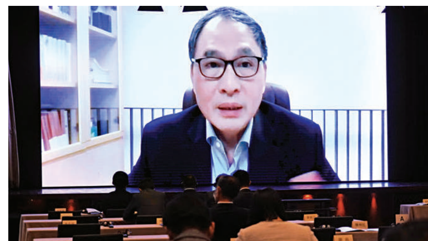
►原新加坡國立大學東亞研究所所長、英國諾丁漢大學終身教授、中國問題專家鄭永年稱讚，中國共產黨是一個使命型的政黨，一個開放型的政黨，一個非常注重政治參與的政黨，亦是一個有強烈的自我改革、自我革命意願的政黨。

鳩山由紀夫指出，2012年習近平就任總書記以來，僅用八年時間，就讓一億國民正式脫離貧困，這在世界史上也是絕無僅有的。而中國實現脫貧攻堅目標的成功秘訣，就是中國共產黨時刻和中國人民站在一起。改革開放以來，中國的長期經濟發展舉世矚目，而這將成為中國共產黨最重要的成果之一。鳩山由紀夫強調，去年新冠病毒蔓延全球