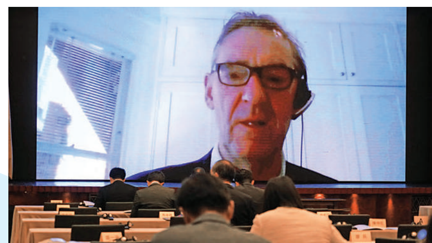
►高盛前首席經濟學家、「金磚之父」吉姆·奧尼爾表示，中國在如何進一步減少貧困和不公平現象方面，有偉大的經驗可以幫助其他國家。

鄭永年指出，使命是什麼？使命就是中國共產黨對人民的承諾，然後兌現它的承諾。和其他政黨相比，並看不到其他政黨有五年計劃、十年計劃，但中國共產黨有。「中國共產黨是一個開放型的政黨。」鄭永年認為，一個層面是中國共產黨是吸納社會各界精