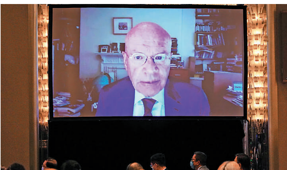
►英國劍橋大學前高級研究員、清華大學訪問教授馬丁·雅克在發言中指出，中國共產黨是當代最成功的政黨，是一個極為有活力的組織，屢次證明了自己有能力與時俱進的政黨。

最後，他強調，中國法律改革支持國家發展，現代化進程取得積極成果，前景良好；中國人民受益於日漸成熟的法律和法律機構提供的保護。隨著中國不斷向前發展，法治建設對中國具有不可或缺的意義。