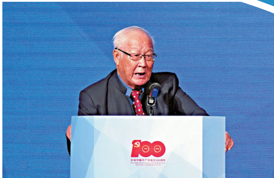
►馬來西亞大馬新聞資訊學院院長、香港中文大學政治及行政學系前系主任鄭赤琰指出，「一國兩制」已向世界展示，不同意識形態的國家，只要放棄對彼此的偏見，互相包容，是最佳的治理資本主義與社會主義的辦法。