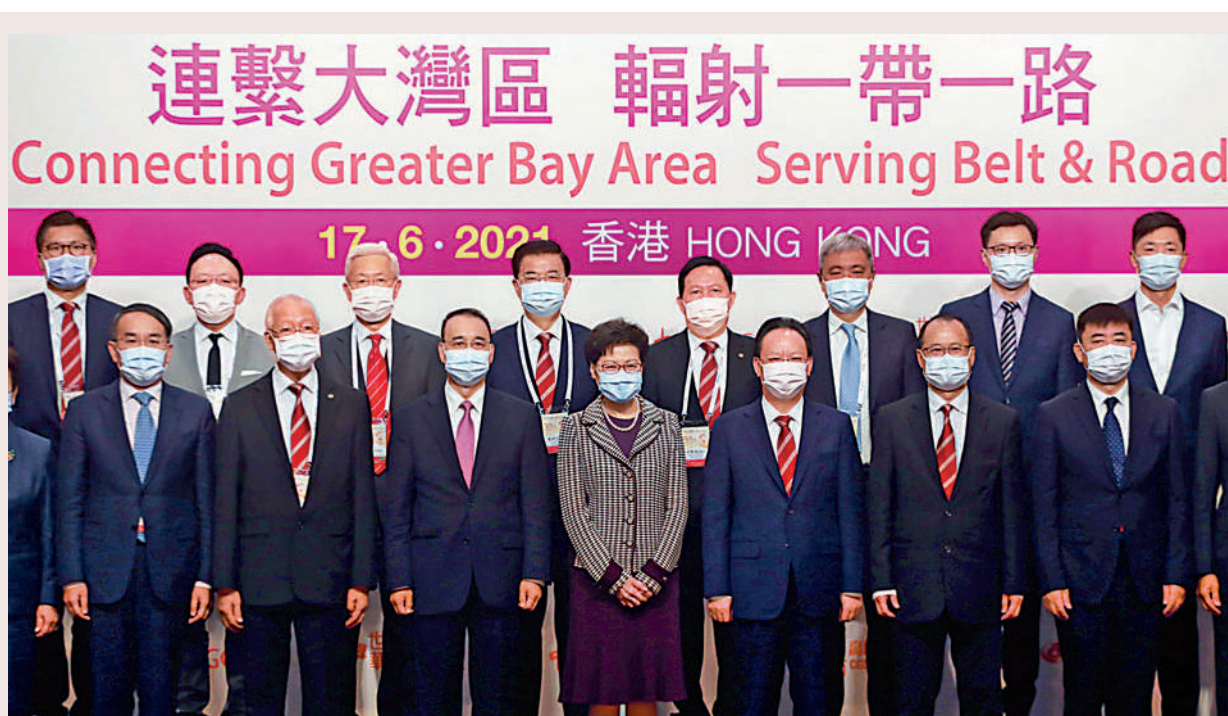
特首林鄭月娥(前排左四)、中聯辦副主任譚鐵牛(前排左五)、外交部駐港公署特派員劉光源(前排左三)、中總永遠名譽會長蔡冠深(前排左六)等嘉賓出席昨日的論壇。

長遠來說，應把眼光擴大到「跨太平洋夥伴全面進步協定」(CPTPP)，團結全球華商，推動RCEP和CPTPP互惠互利發展，以打破貿易壁壘，造福全球。