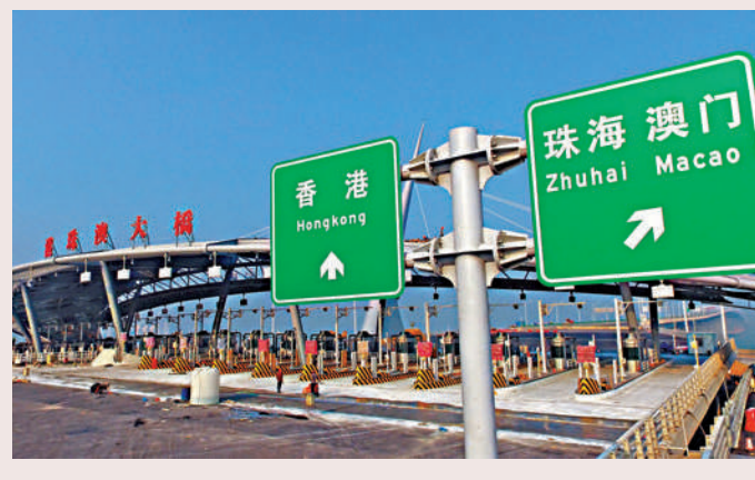
林鄭月娥表示，大灣區建設是香港在雙循環發展中的最佳切入點。