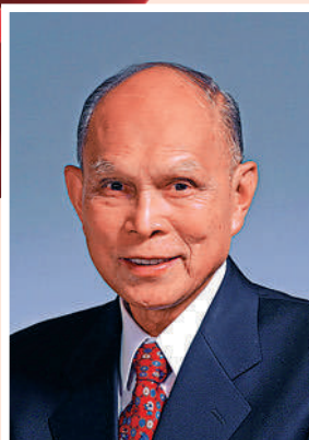
▲香港著名愛國人士霍英東。