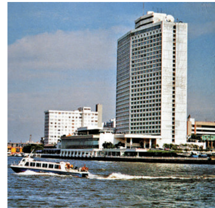
▲廣州白天鵝賓館外景，攝於一九九六年。