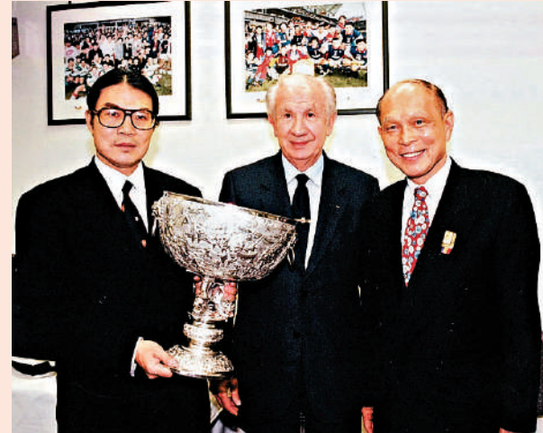
▼一九九八年，霍英東（右）、霍震霆（左），與時任國際奧委會主席薩馬蘭奇合照。資料圖片