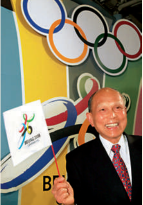
▲霍英東為中國申辦奧運不遺餘力。

霍震霆那時已是父親的左膀右臂，直接參與了一系列重要活動。他帶著香港單車隊參加德黑蘭亞運會，和父親一道為恢復中國在體育界的合法席位東奔西走，先後幫助中國恢復了在亞足協、亞羽聯、亞自（單車）等國際單項體育組織中的合法席位，為中國在一九七九年重返國際奧委會打下了堅實基礎。