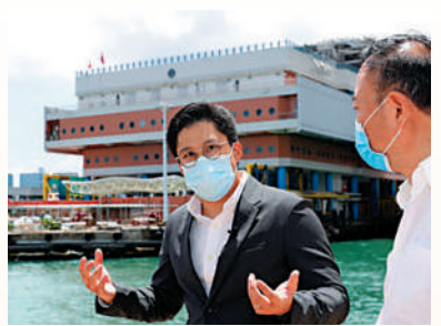
▲霍啟剛（左）希望有一天，粵港澳大灣區一起舉辦全運會。