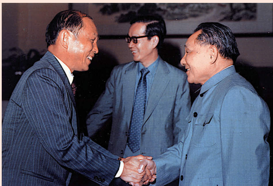
◀鄧小平（前排右）多次會見霍英東（前排左）。