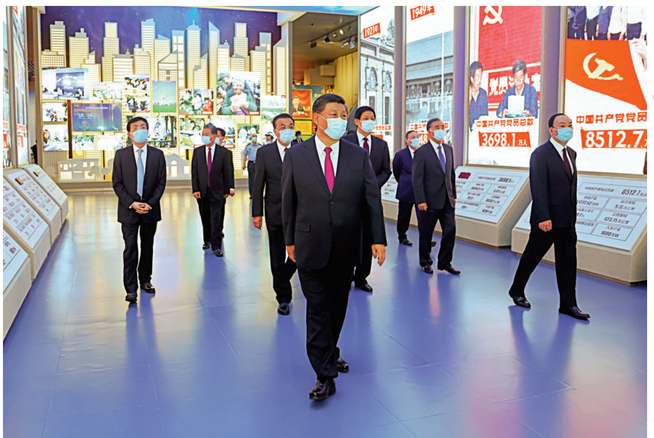
18日，黨和國家領導人習近平、李克強、栗戰書、汪洋、王滬寧、趙樂際、韓正、王岐山等在中國共產黨歷史展覽館參觀「『不忘初心、牢記使命』中國共產黨歷史展覽」。

展覽結尾部分，專門設計了一條「時空隧道」。大屏幕影像通過選取1921、1949、1978、2012、2020年5個重要時間節點，在光影變幻中展現我們黨百年波瀾壯闊的歷史進程。