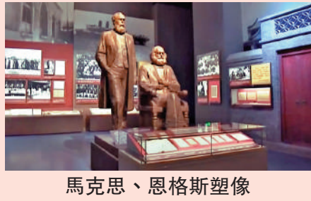
馬克思、恩格斯塑像