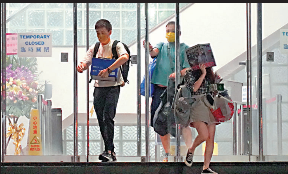
◀ 昨日傍晚起，陸續有壹傳媒員工即時辭職，手捧紙皮箱走出大門。

《蘋果日報》三間公司「蘋果日報印刷有限公司」、「蘋果互聯網有限公司」、「蘋果日報有限公司」涉嫌違反香港國安法，1800萬元資產被凍結後，《蘋果》仍狂印50萬份炒作新聞，耗費數百萬元後，高層才突然驚覺餘下的營運資金只能捱數日。