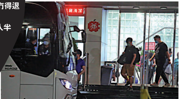
▲昨晚不斷有壹傳媒員工執包袱離開。