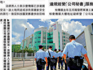
▲《大公報》上周五率先報道壹傳媒辦公大樓地皮或會被收回。

【大公報訊】記者周揚報導：壹傳媒在將軍澳工業邨的辦公大樓，因涉嫌違反地契條款，被科技園公司收回地皮。據悉，該大樓的土地用途為工業用途，但壹傳媒在該大樓內經營媒體業務，違反了地契的規定。科技園公司表示，他們將收回該大樓的地皮，並重新招標出租。