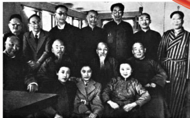
一九四九年，由香港海員護送北上參加第一屆政協會議的部分民主人士在「華中輪」上合影。