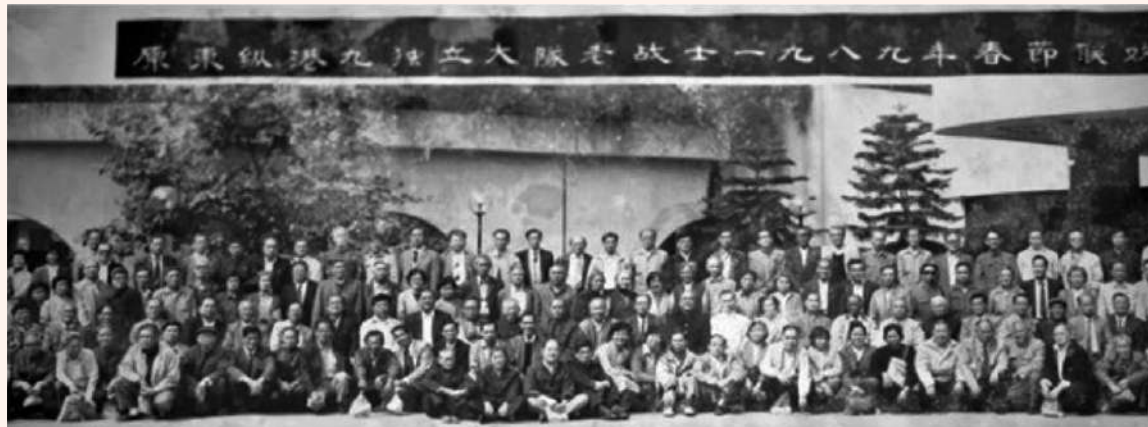
東江縱隊成為了華南地區一股實力強大的抗日武裝力量。圖為原東江縱隊港九獨立大隊老戰士在一九八九年春節聯歡合影留念。資料圖片

1941年12月，日軍攻佔香港，加緊搜尋當時正身處香港的民主進步人士和文化界名人，如茅盾、田漢、何香凝、鄒韜奮、梅蘭芳等。中共領導的東江縱隊卻早着先機，動員各種人力與方法，在日寇嚴密監控下，將數百名文化界人士——安全轉移離港。參與這場「秘密大營救」的有許多是香港海員，正如黎啟穗所說，「這些都是歷史，歷史會記得的。」