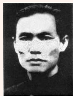
2009年，蘇兆徵被評為「100位為新中國成立作出突出貢獻的英雄模範人物」。

說。蘇兆徵1926年在第三次全國勞動大會上當選為中華全國總工會委員長。1927年在中共五大上，蘇兆徵當選為中央委員、政治局候補委員；在中共八七會議和中共六大上，均被選為政治局委員、常委，成為中共中央領導人之一。由於長期操勞過度，積勞成疾，1929年2月25日，蘇兆徵於上海病逝，年僅44歲。2009年，他被評為「100位為新中國成立作出突出貢獻的英雄模範人物」。