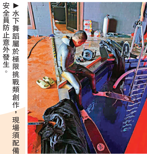
▲水下舞蹈屬於極限挑戰類創作，現場須配備安全員防止意外發生。