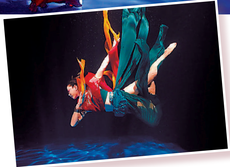
▲獻禮中國共產黨成立100周年而創作的「水下舞蹈《紅》」。