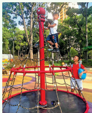
屯門公園共融遊樂場的「繩網沙池轉」，盡得小朋友歡心。

屯門公園共融遊樂場的設計首次加入「水」和「沙」兩項自然元素，由於疫情的緣故，「水」的部分暫停開放，不過旁邊的遊樂設施則是加入更具挑戰性、冒險性的設計。當中有滾輪滑梯、攀爬冰沙轉等，在其他的遊樂場亦十分少見。