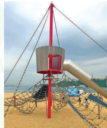
大白灣沙灘兒童遊樂場有香港少見的繩網連長滑梯。

大白灣沙灘兒童遊樂場是近年受大人小朋友歡迎的免費兒童遊樂場，除了可以暢泳外，還可以玩不同類型的玩樂設施。大白灣沙灘遊樂場自2017年引入多款香港罕有的遊樂設施，於2019年底進一步擴建沙灘遊樂場，增添全新遊樂組合設施。當中包括我們上兩期介紹過的鞦韆外，還有香港罕有的繩網連長滑梯、全港遊樂場獨有的飛天吊索、「風火輪」等等，實在讓人樂而忘返。