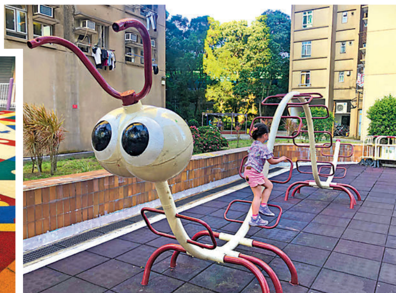
這座大型的毛毛蟲攀爬鐵架考驗小朋友創意。