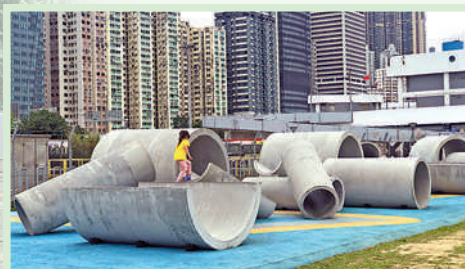
「捐山窿」一樣讓小朋友玩足大半日。

「捐山窿」公園顧名思義就是可以「捐山窿」（穿山洞），大型的渠管遊戲，讓小朋友任意攀爬。設計以1970年代葵涌石硤邨渠管遊樂設施作為參考，現今的小朋友既可以挑戰不同的高度，更可以當半截管道為滑梯，盡情玩樂，創意十足。