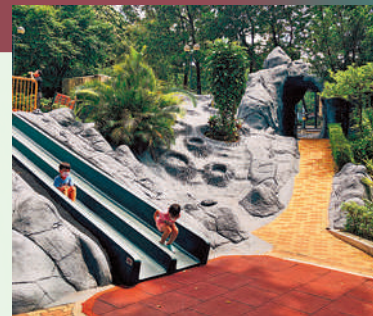
位於京士柏遊樂場的舊式長滑梯。