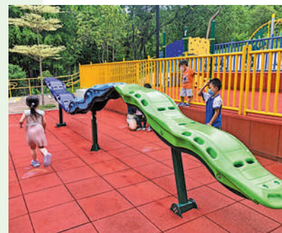
青衣公園的巨型毛蟲攀爬架刺激好玩。

青衣公園的兒童遊樂場區域分為四層，每層有不同的遊樂設施。而有部分遊樂設施可謂十分少見，如這個巨型毛蟲攀爬架，別看其只是一個簡單的攀爬架，其實另有乾坤，這個攀爬架是可移動的，絕對是考驗小朋友的平衡力，甚具挑戰性。而另一層則見馬仔搖搖椅，可以幾個小朋友一起坐然後前後移動，非常有趣味。