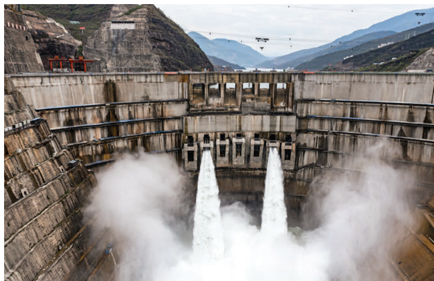
▲金沙江白鶴灘水電站首批機組於6月28日安全準點投產發電。圖為白鶴灘水電站大壩。新華社

【大公報訊】據新華社報道：金沙江白鶴灘水電站首批機組於28日安全準點投產發電。中共中央總書記、國家主席、中央軍委主席習近平發來賀信，表示熱烈的祝賀。