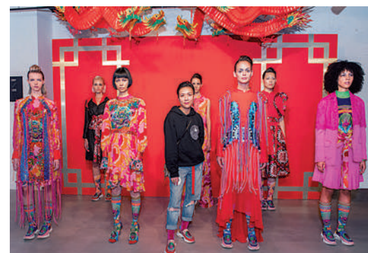
▲「九龍」系列曾亮相2020春夏的倫敦時裝周。

墨水將圖紋打印在香雲紗之上，令每一季時裝呈現出獨特的風格。除了物料，中國民間傳說和節氣也成為「碌祿」有趣的設計元素。品牌的第一個三部曲系列是「梁祝」、「白蛇傳」、「牛郎織女」，接着是「驚蟄」、「芒種」、「寒露」。「有一次經過銅鑼灣鴻頸橋，見到橋底人頭湧湧『打小人』，那日原來是驚蟄。發現這個節氣很有趣，就決定以此設計系列。驚蟄，萬物復甦，感覺微妙，所以使用了大量富中國特色的印花來演繹這個節氣特點。」