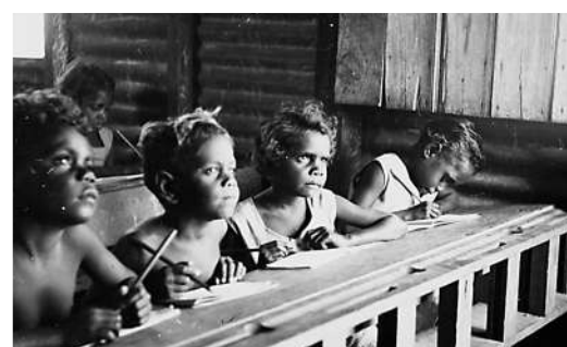
▲為推行「白澳政策」，澳洲政府將約10萬名原住民兒童與家人分開。網上圖片

另外，澳洲國家課程改革草案5月發布，將「批判性種族理論」寫進歷史課程教學大綱，包括首次將英國殖民者抵澳稱為「入侵」。但參議院21日通過動議，阻止批判性種族理論進入國家課程。