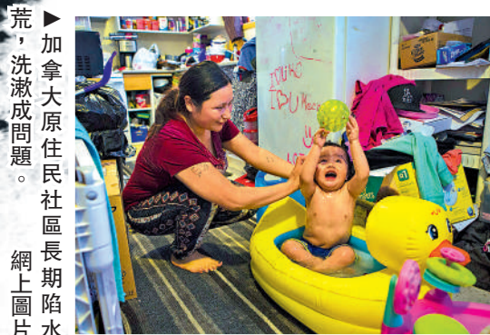
▶加拿大原住民社區長期陷水荒，洗滌成問題。網上圖片

另外，在輿論壓力下，加拿大21日終允許原住民在護照、身份證明、永久居民文件和社會保險卡上使用本族姓名。實際上，加拿大真相與和解委員會早在2015年就提出了這個建議，但是一直沒有被政府接受。