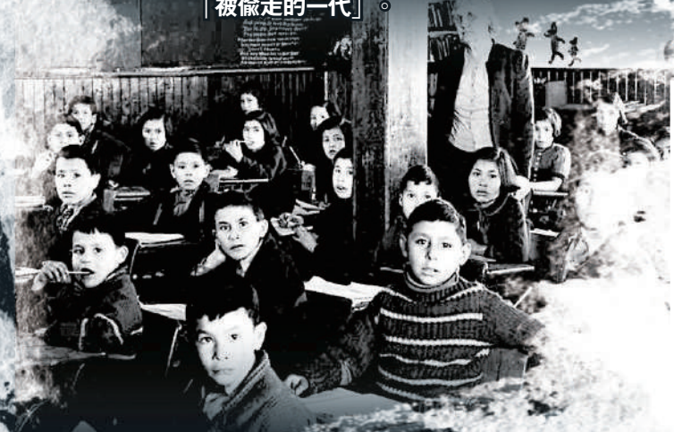
▲1950年，加拿大薩斯喀徹溫省一所寄宿學校的原住民在上課。