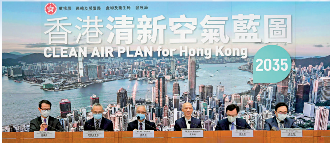
▲環境局局長黃錦星（右三）昨日主持《香港清新空氣藍圖2035》記者會，闡述至二〇三五年提升香港空氣質素的挑戰、目標和策略。