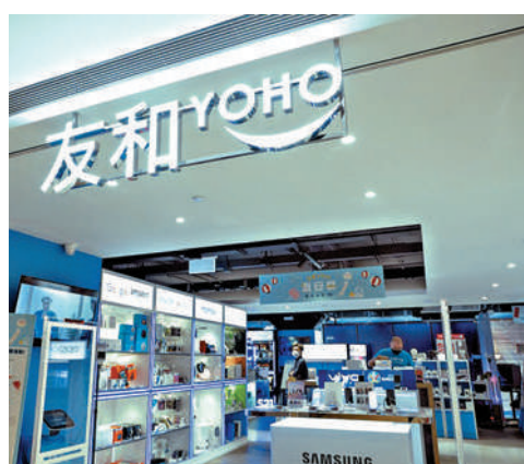
▲友和在香港以電子產品及家庭電器為主的電子商務平台中位列榜首。

過去三年（2018年至2020年），友和的收益分別為1.35億、2.59億及5.23億，收益顯著增加，但毛利率卻在下跌，過去三年分別為24.3%、20.5%及17.4%。管理層在招股文件上的風險因素也提及到「業務面對激烈競爭，盈利能力及未來增長前景取決於能否有效與其他競爭對手進行競爭」，而且也有提及「無法保證毛利率於未來不會繼續下降。倘日後未能維持收益增長且毛利率持續下降，業務、財務狀況及經營業績可能會受到不利影響。」